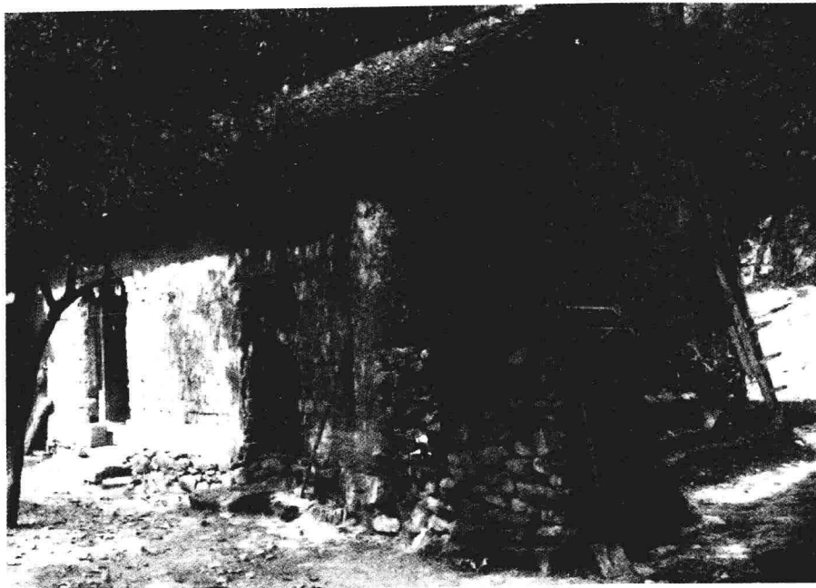
侯寨知青农场九连男知青住住过的老屋