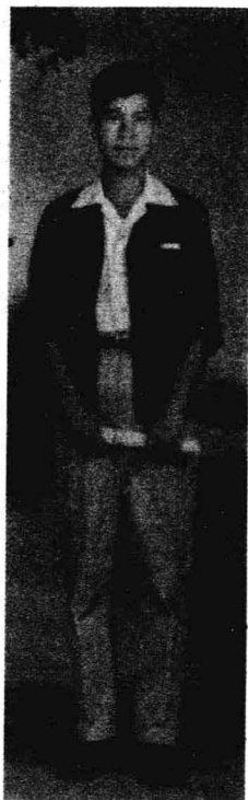
作者1996年留影，初上讲台