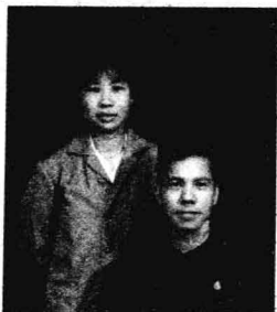
作者1998年留影左为作者妻子