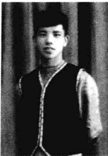
作者1959年留影（舞蹈队）