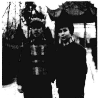
1972年作者与妻子留影