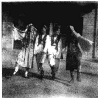
1960年省纺织技工学校得奖节目（鞞鞞舞）