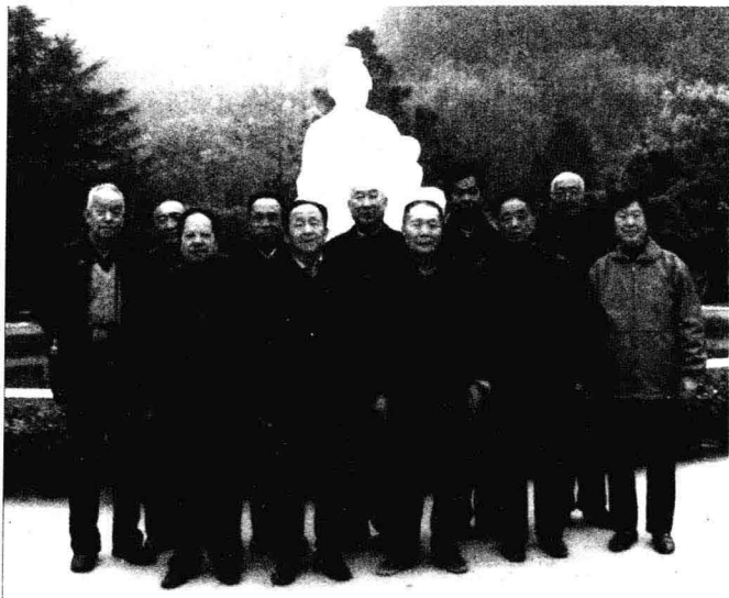
2007年大学同学48年又相会（前左一为作者）

我写了很多关于知青的短篇小说、戏剧、电视剧等。那时，大作家都住牛棚了。山中无老虎，我这个猴子自然就成大王了。有些作品现在读起来自感津津有味。这是与那个时代的情结，是与知青农场的情结，是与青年朋友的情结。因为陋室十几次搬迁，绝大部分作品遗失，一次偶然机会，在女儿家里发现以上残存。现作整理取舍，把过去五十多年的部分作品发表过的和没有发表过的文章收集成书出版，与读者共享。