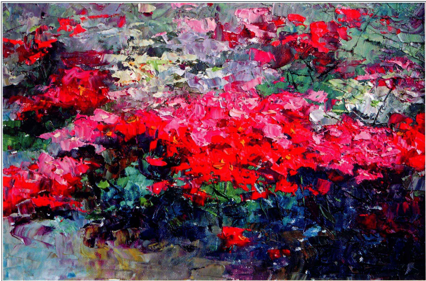
沐 20cm × 30cm