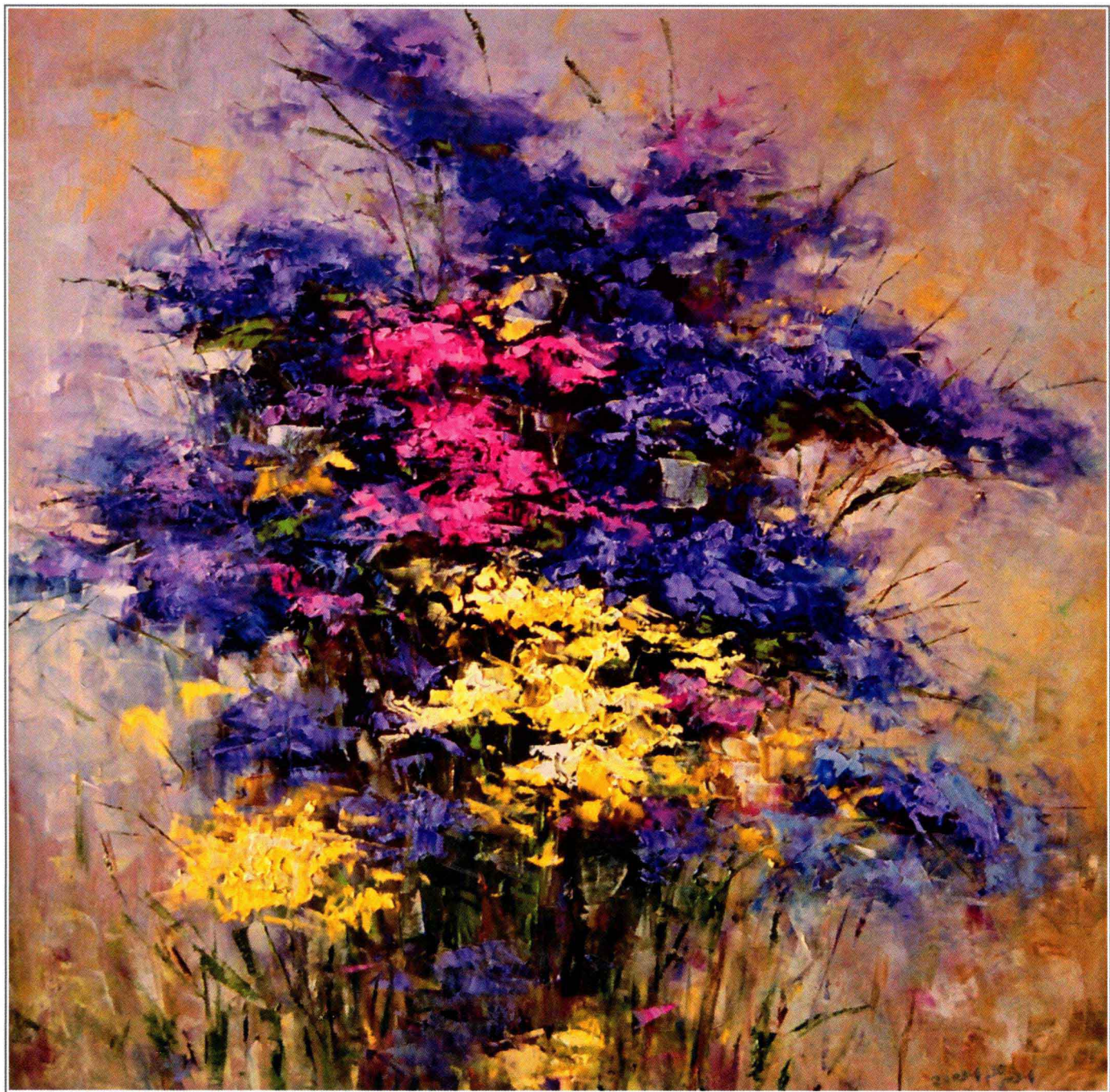
非常时期的感悟 100cm × 100cm