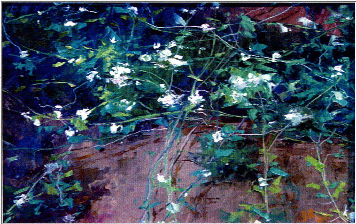
春路旁 20cm × 30cm