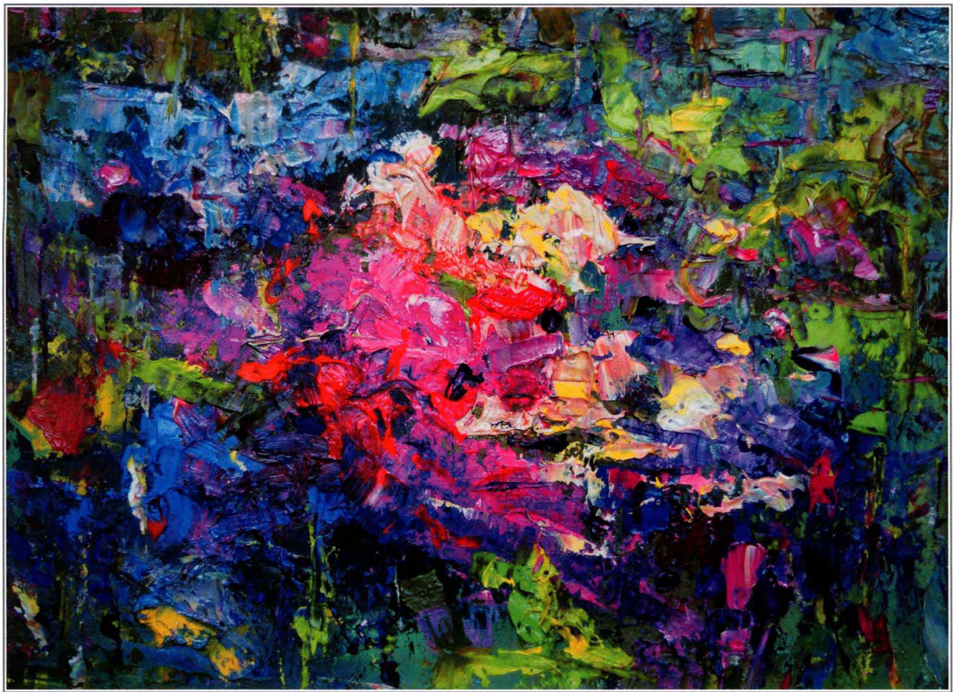
红色音符 20cm × 25cm