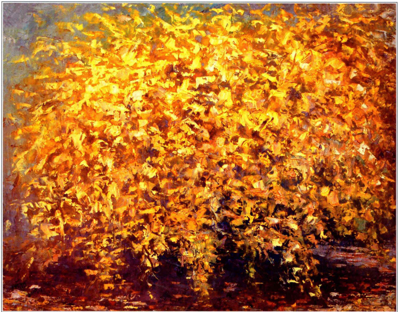
二月的等待 45cm × 40cm