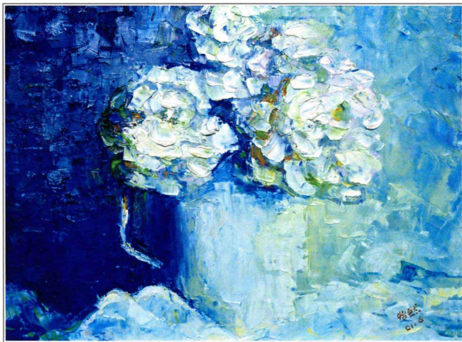
静物 a、静物 b 45cm × 35cm