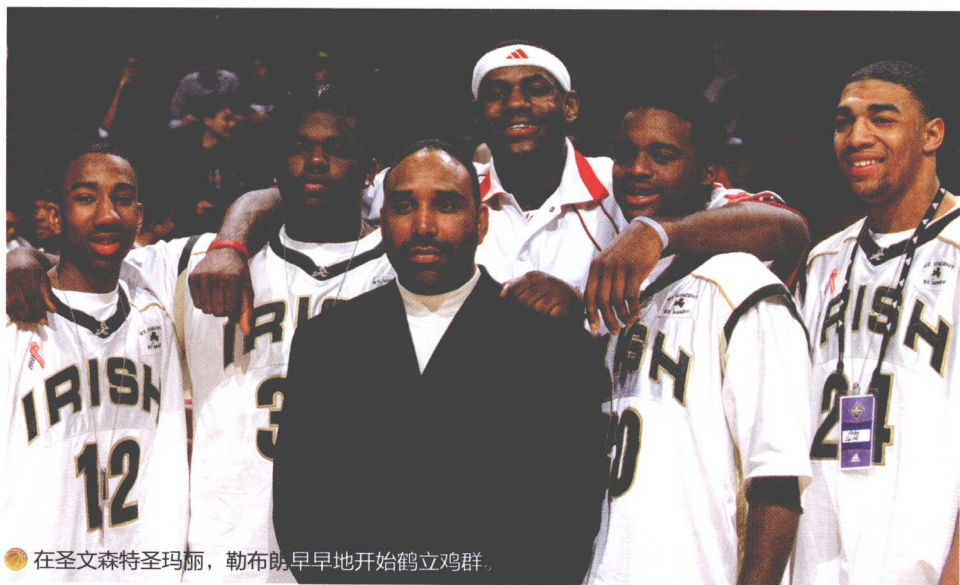
● 在圣文森特圣玛丽，勒布朗早早地开始鹤立鸡群。

来到圣文森特圣玛丽高中的球探中，开始有NBA球队的工作人员出现。围观“战斗的爱尔兰人”打球的群体，开始有点儿朝大学篮球甚至NBA规模靠拢。勒布朗，勒布朗，勒布朗。所有人都在交头接耳。远方而来的人们踮起脚尖，到处打探：谁是勒布朗？就是那个最高的？哇，他真的还没满16岁？！