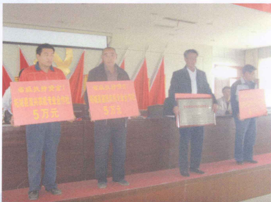
奖励优秀农机合作社