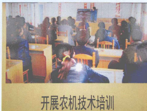
开展农机技术培训