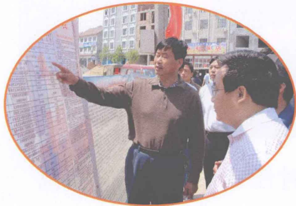
县委书记张家明检查 农机补贴工作