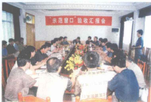
部级窗口单位验收