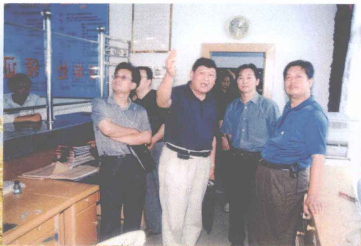
上级领导来站指导部级 窗口单位创建