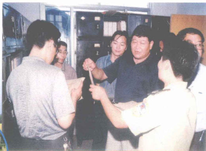
省农机局领导来站检查指导