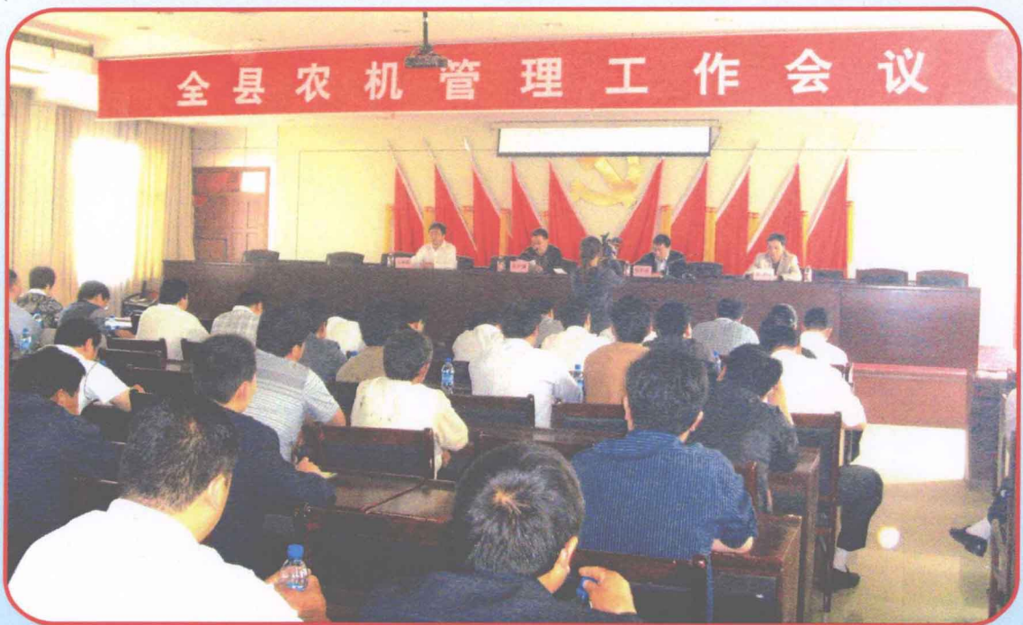
领导重视 层层抓落实