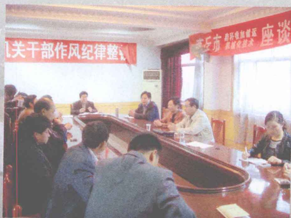
强化纪律 努力工作