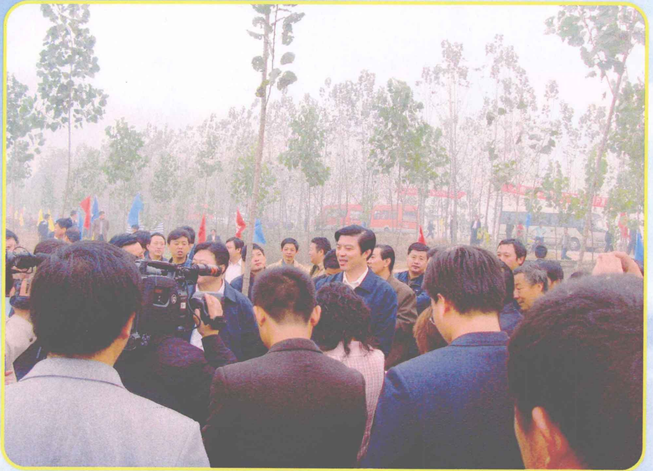
市委书记陶明伦（时任市长）莅临柘城 指导农机工作