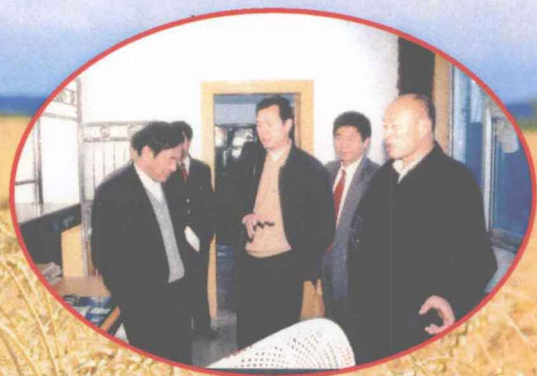
领导来站检查档案工作