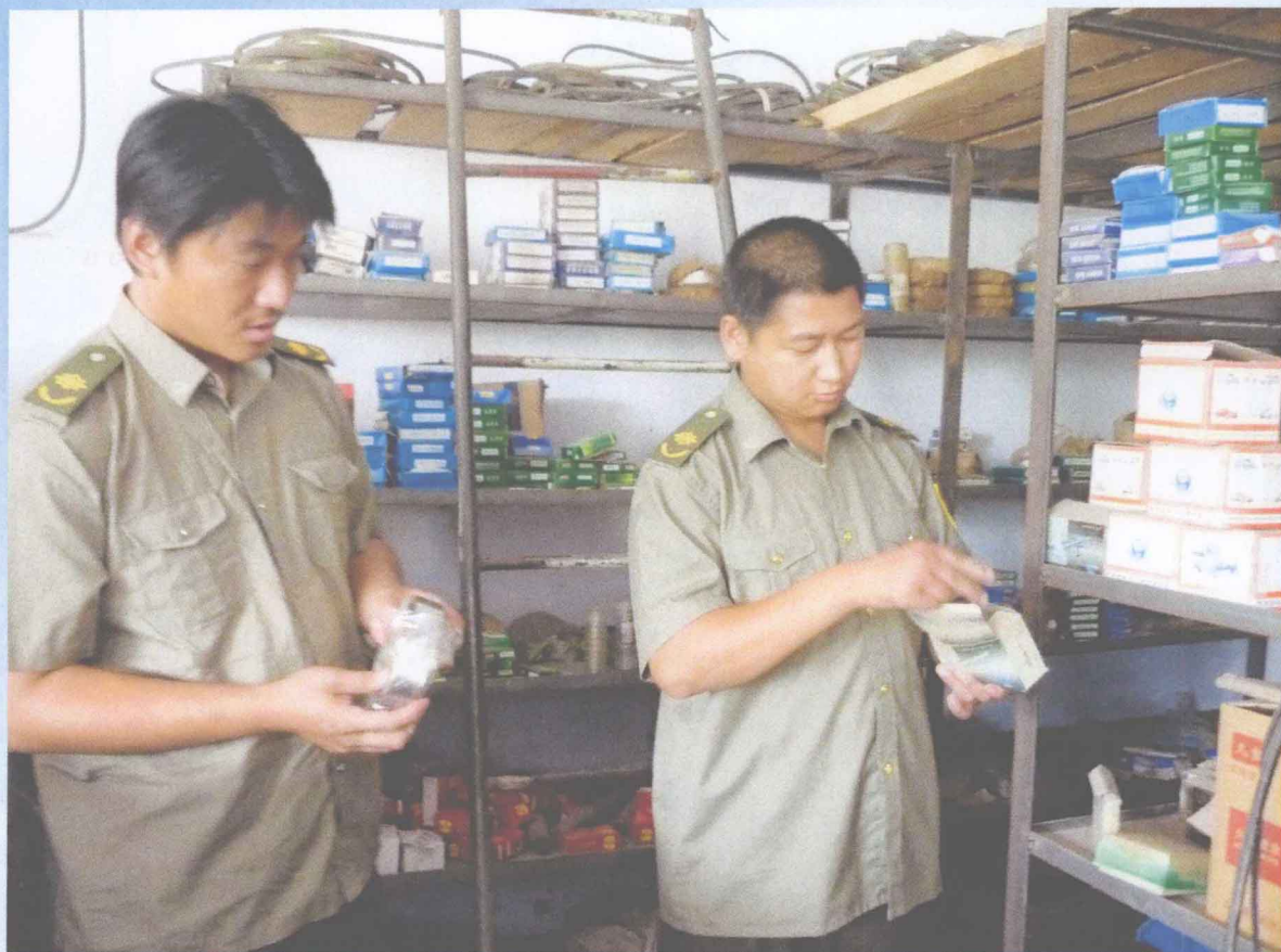
查处假冒伪劣 确保农机安全