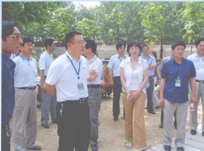
人大副主任张炎耀带领人大代表 检查农机执法工作