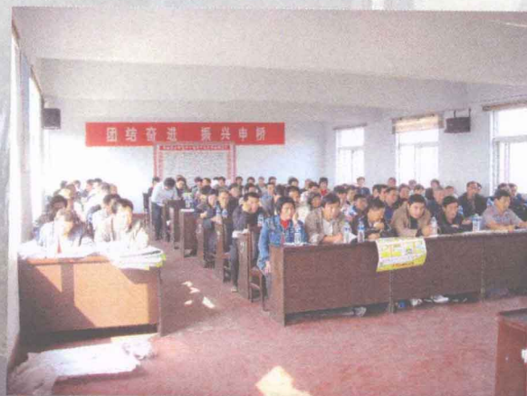
申桥乡召开创建动员会