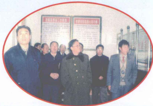
上级领导来站检查工作