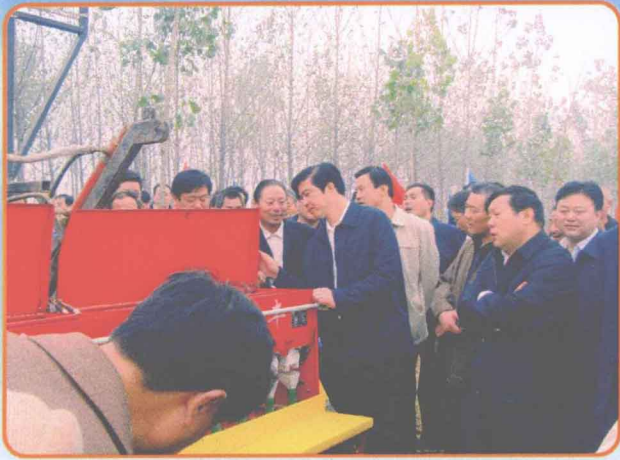
市委书记陶明伦来柘检查农机安全工作