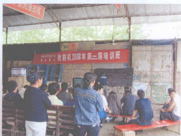
深入经销企业培训