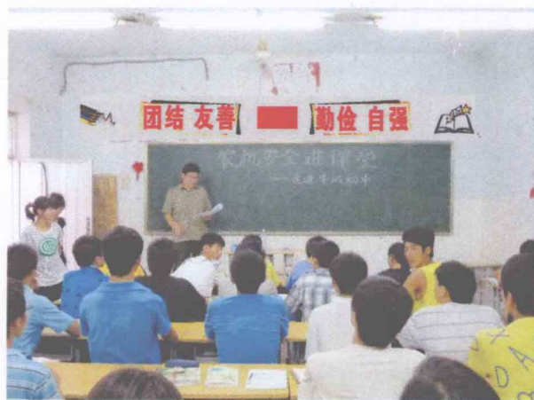
给学生上一堂农机安全课