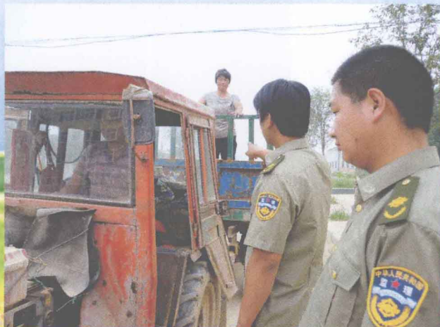
治理农用车非法载人