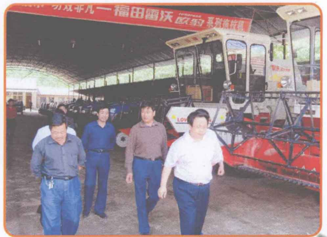
县委书记张家明深入基层 检查农机工作