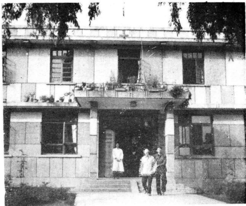
新都县龙桥人民公社卫生院