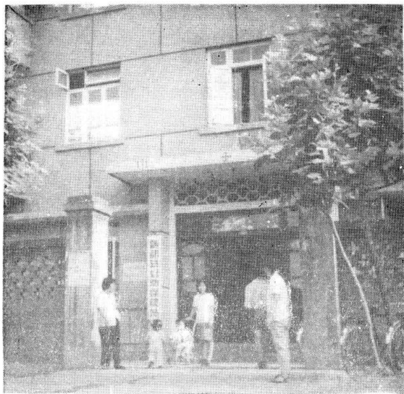
新都县妇幼保健站