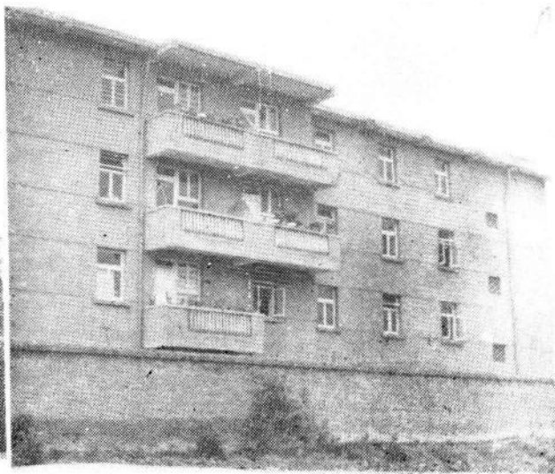
一九八一年特大洪灾后人民 政府拨款新建的新都县石板滩人 民公社卫生院宿舍楼