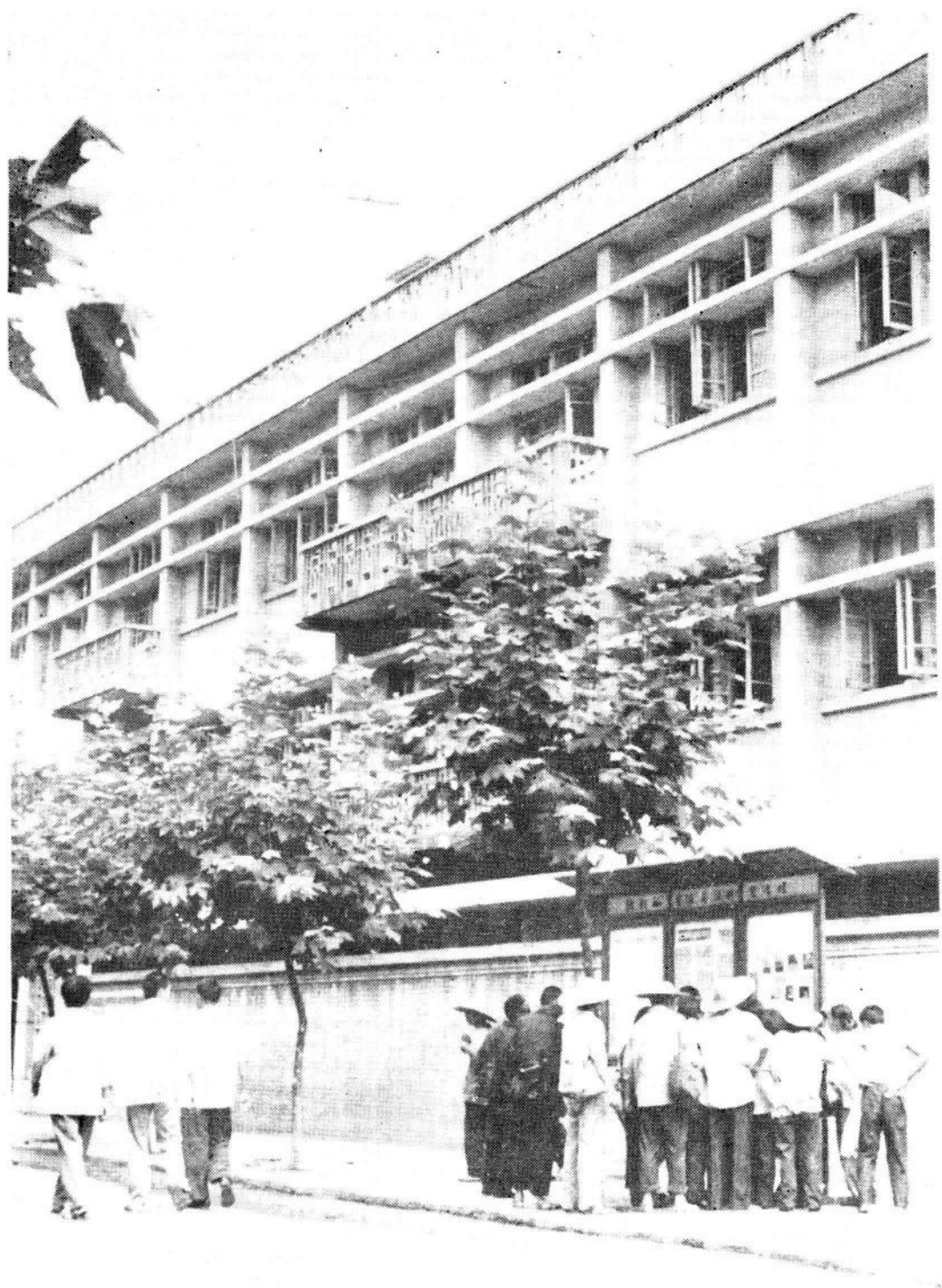
新都县卫生局办公楼