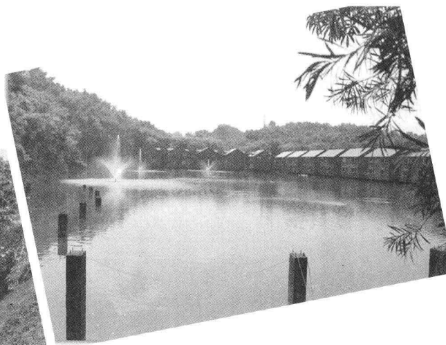
▲ 南元休閒農場的小木屋