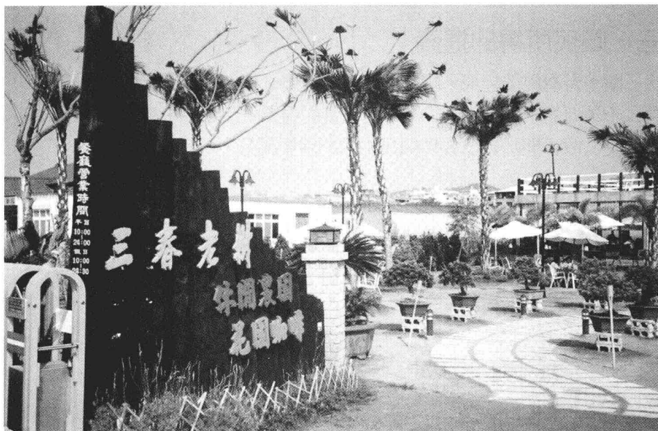
◀ 結合休閒活動與鄉土風情的休閒農業