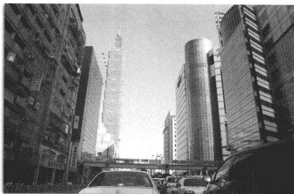
▲擁擠的都市叢林，使人渴望回歸自然

生命與農業是息息相關的，長久以來，人們對農業的認知，多半侷限於生產功能；事實上，生活與生態保育的功能更是農業無盡的寶藏。近年來，台灣的農業發展成績斐然，更值得慶幸的是，多年來仍保有許多農業和農村的