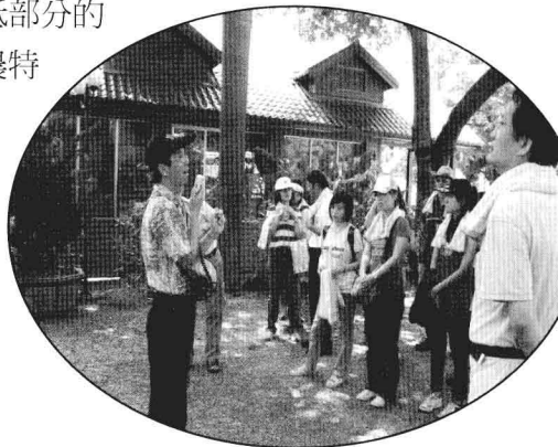
▲休閒農場提供良好的教學場所