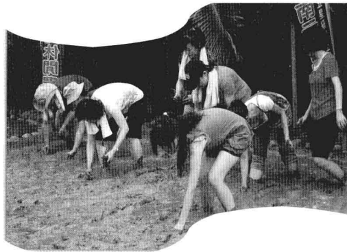
▲南元休閒農場中的種稻體驗

休閒農業可提供農村及環境的知識，對於許多想要求知的人而言，是最好的戶外教學場地。