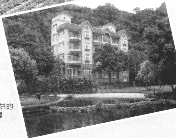
▶頭城休閒農場提供的 住宿設施—朝日樓