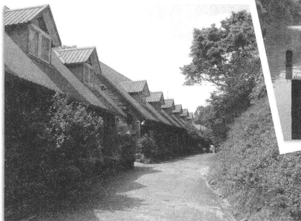
▲ 香格里拉休閒農場的小木屋