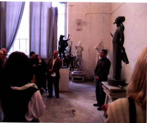
列宾美术学院毕业答辩 2005