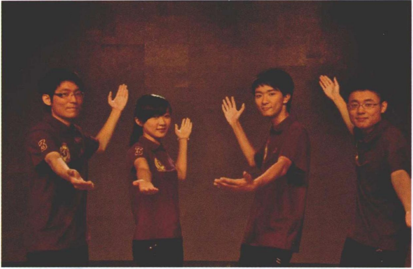
2010年8月，北京。两岸四地高校世博辩论大赛，西南政法大学队决赛阵容。