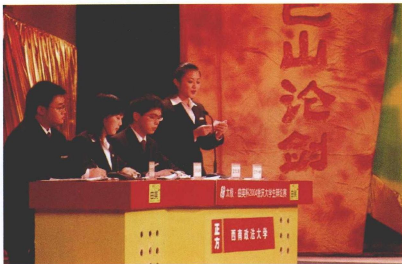
2004年7月，重庆。西南政法大学队参加重庆市大学生辩论赛现场。