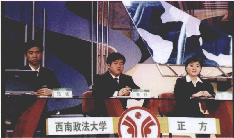
2002年11月，上海。第八届中国名校大学生辩论赛比赛现场。