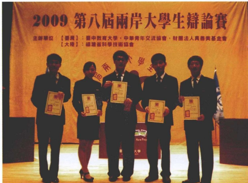
2009年7月，台灣。第八屆海峽兩岸大學生辯論賽，西南政法大學辯論隊合影。