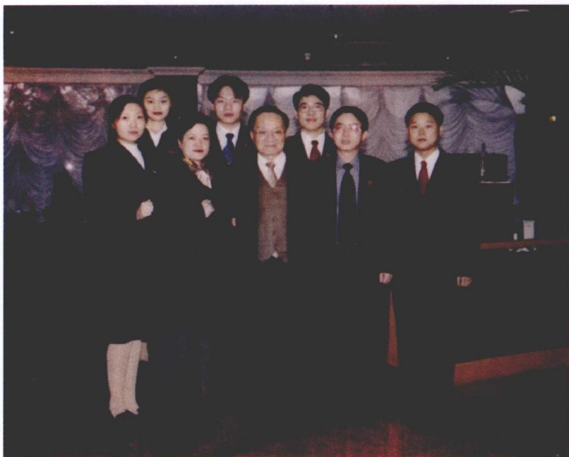
1999年11月，上海。第五届中国名校大学生辩论赛，西南政法大学队与金庸合影。