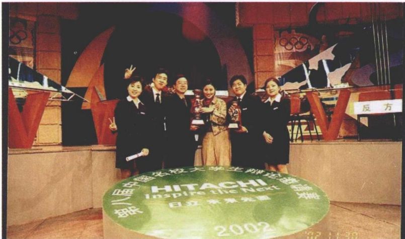
2002年11月，西南政法大学队荣获第八届中国名校大学生辩论赛冠军。