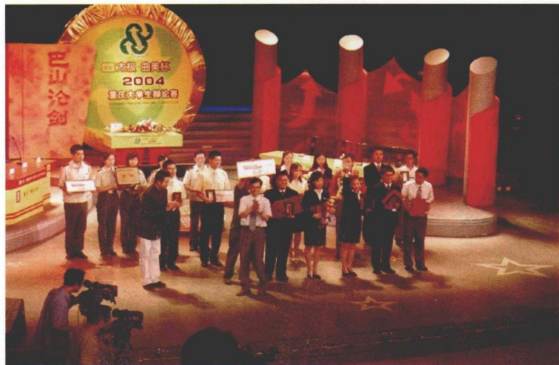
2004年7月，重庆。西南政法大学队荣获重庆市大学生辩论赛冠军。