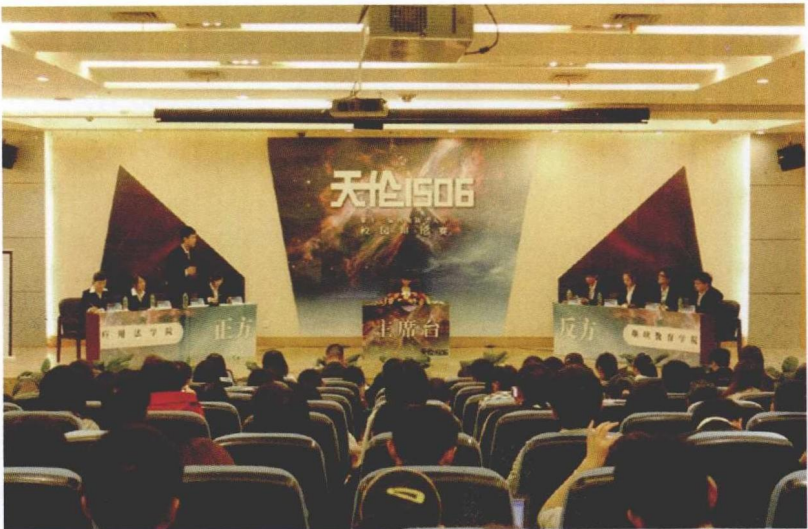
2011年12月，西南政法大学第十二届“天伦1506”辩论赛比赛现场。