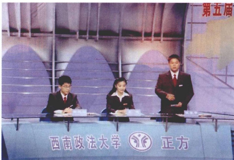
1999年11月，上海。西南政法大学队参加第五届中国名校大学生辩论赛邀请赛现场。