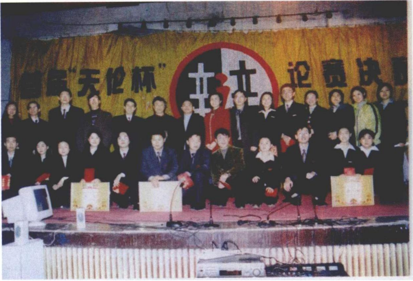
2000年12月，西南政法大学第一届“天伦杯”辩论赛赛后合影。