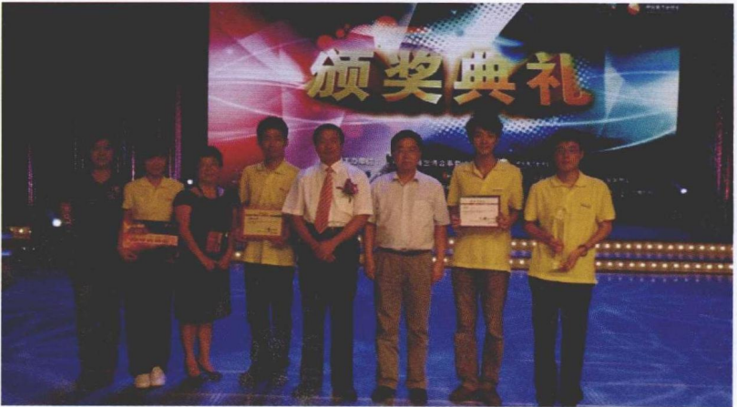
2010年8月，北京。两岸四地高校世博辩论大赛，西南政法大学取得总冠军后合影。