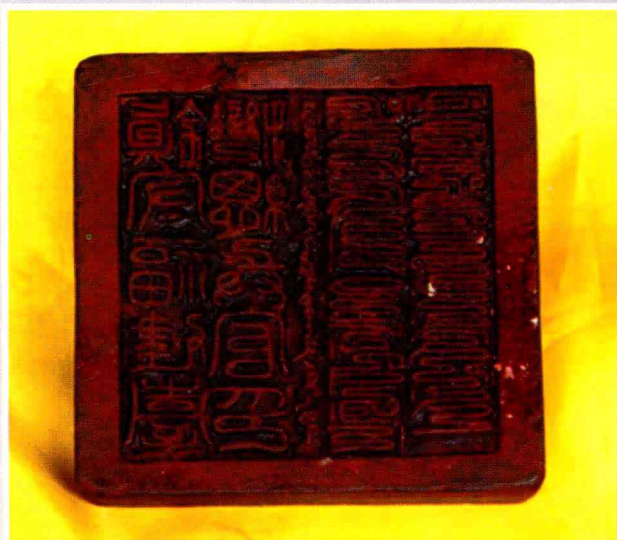
郑成功总兵印 (南澳县海防史博物馆2008年供)