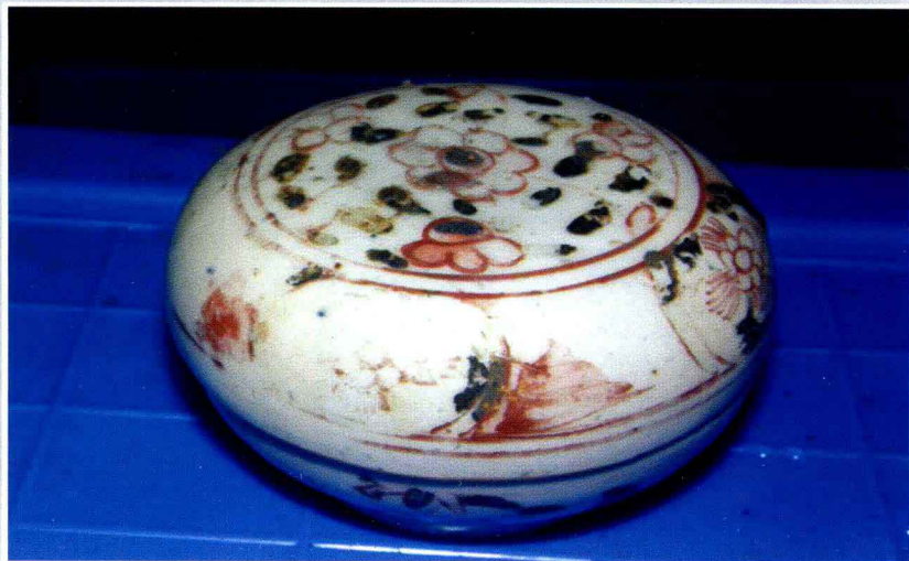
“南澳一号”打捞出水的彩瓷