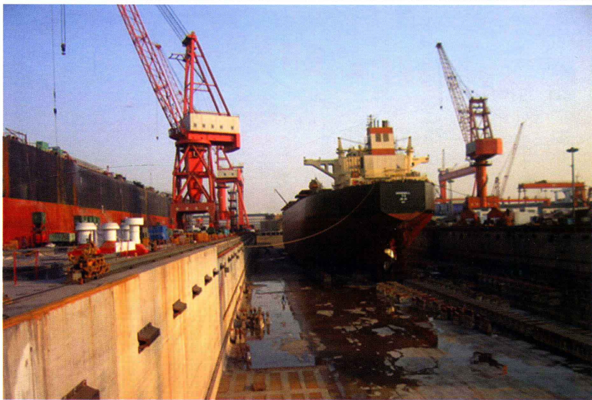
深圳南山孖洲修船基地（2009年摄）