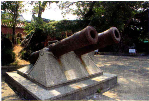
南澳岛总兵府门前大炮