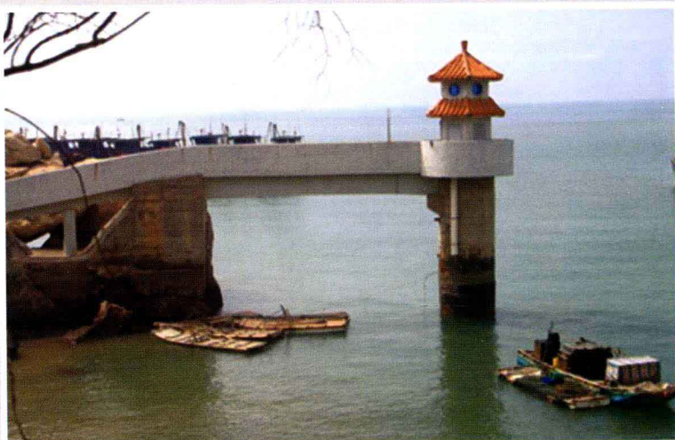
南澳海洋环境监测站 云澳验潮井 (2010年摄)