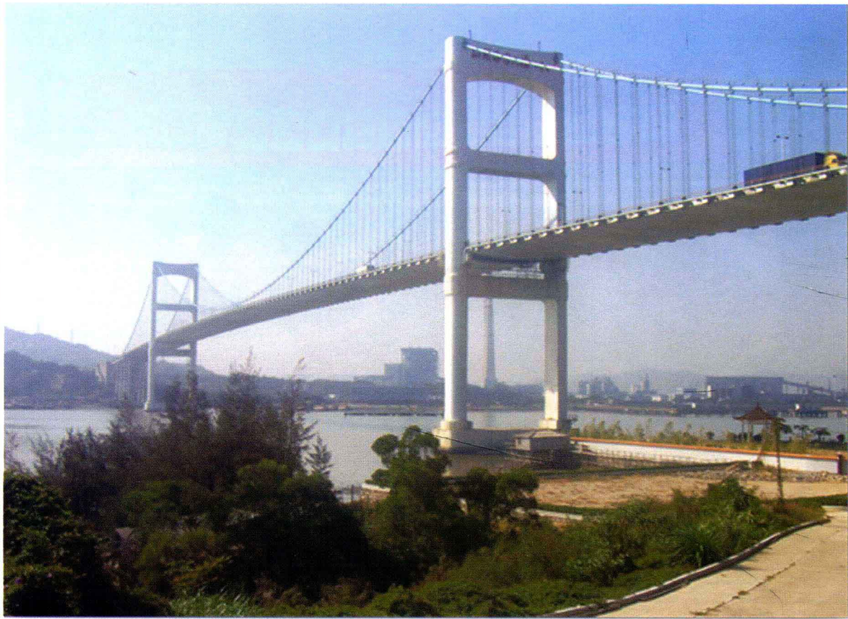
连接妈屿岛的汕头海湾大桥（2009年摄）