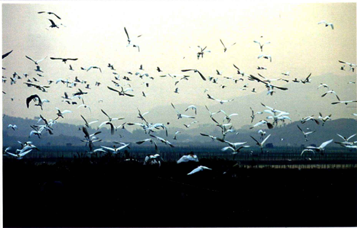
惠州市惠东县盐洲红树林保护区的白鹭 (盐洲办事处2008年供)