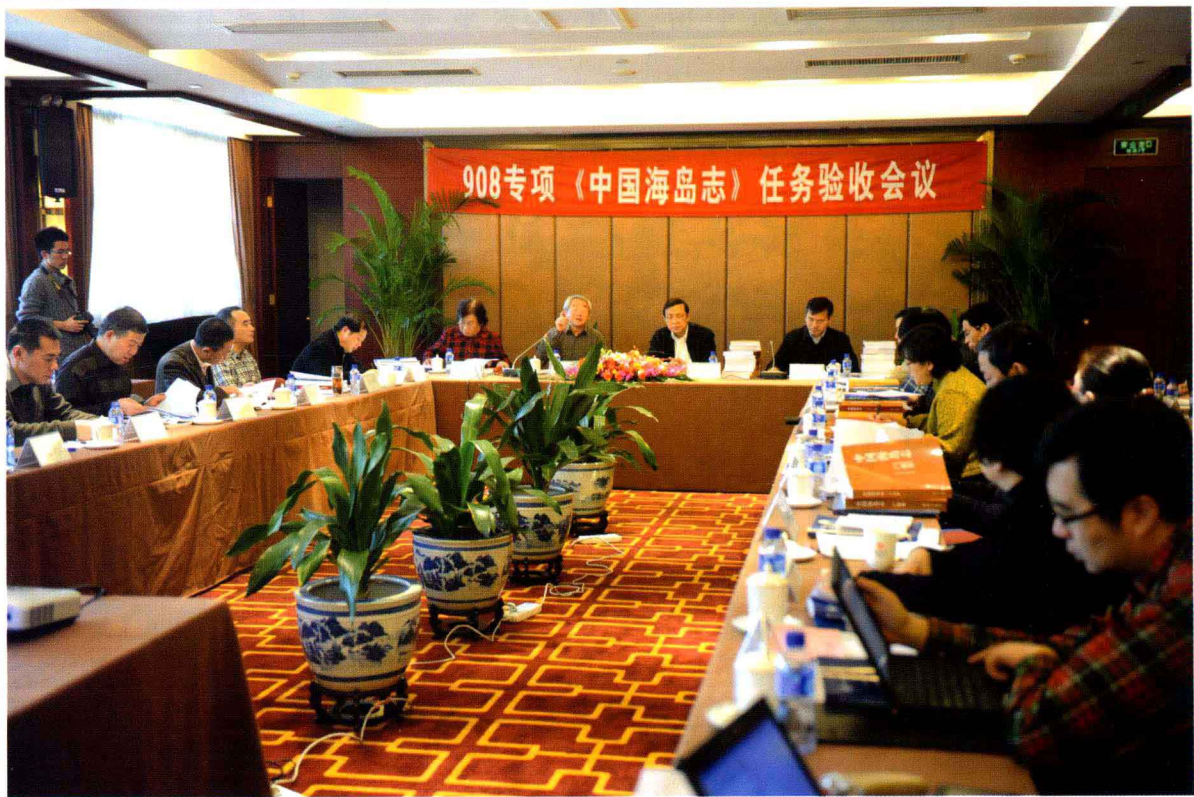
《中国海岛志》验收会议现场