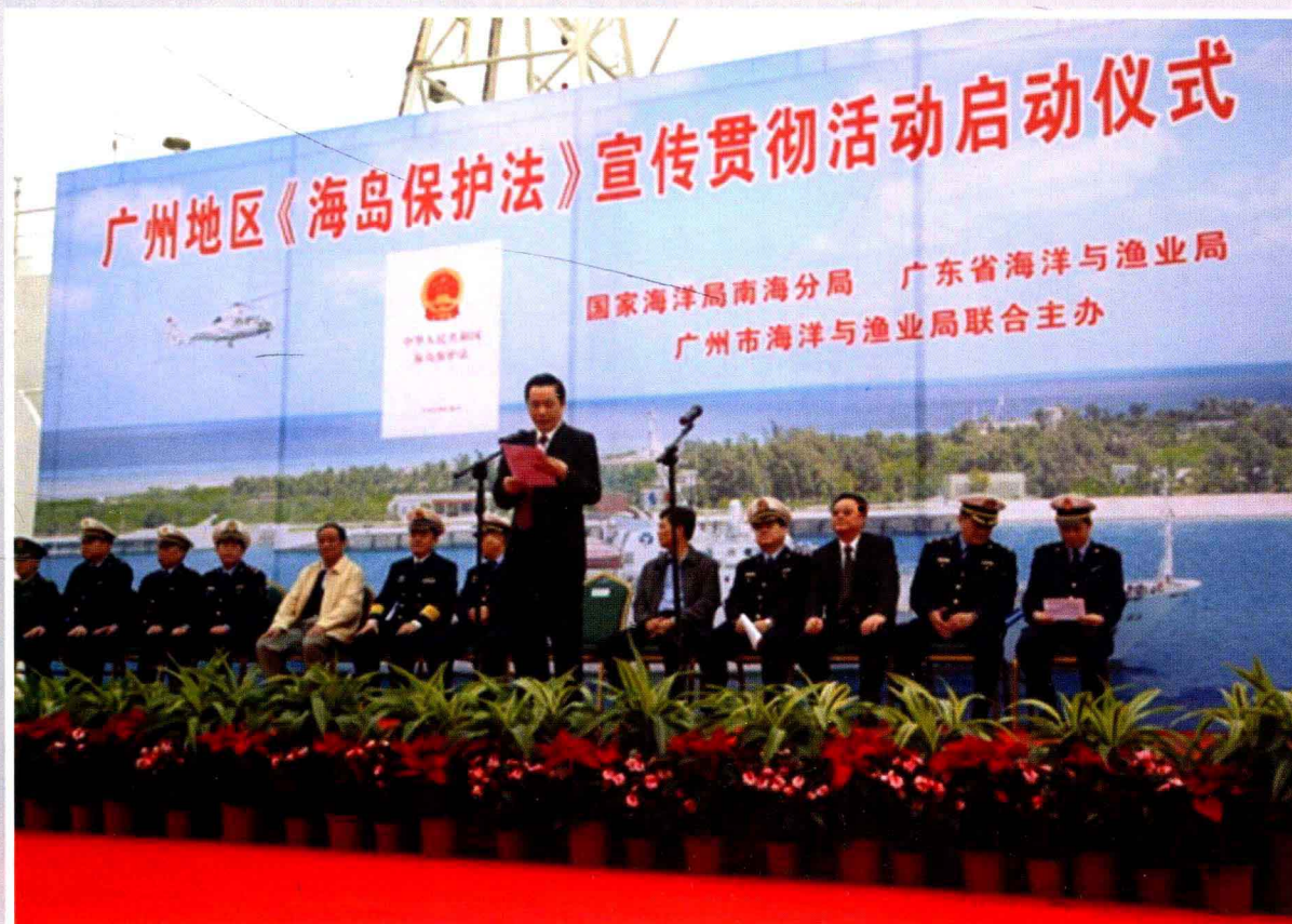
2010年3月1日广州地区《中华人民共和国海岛保护法》宣传活动