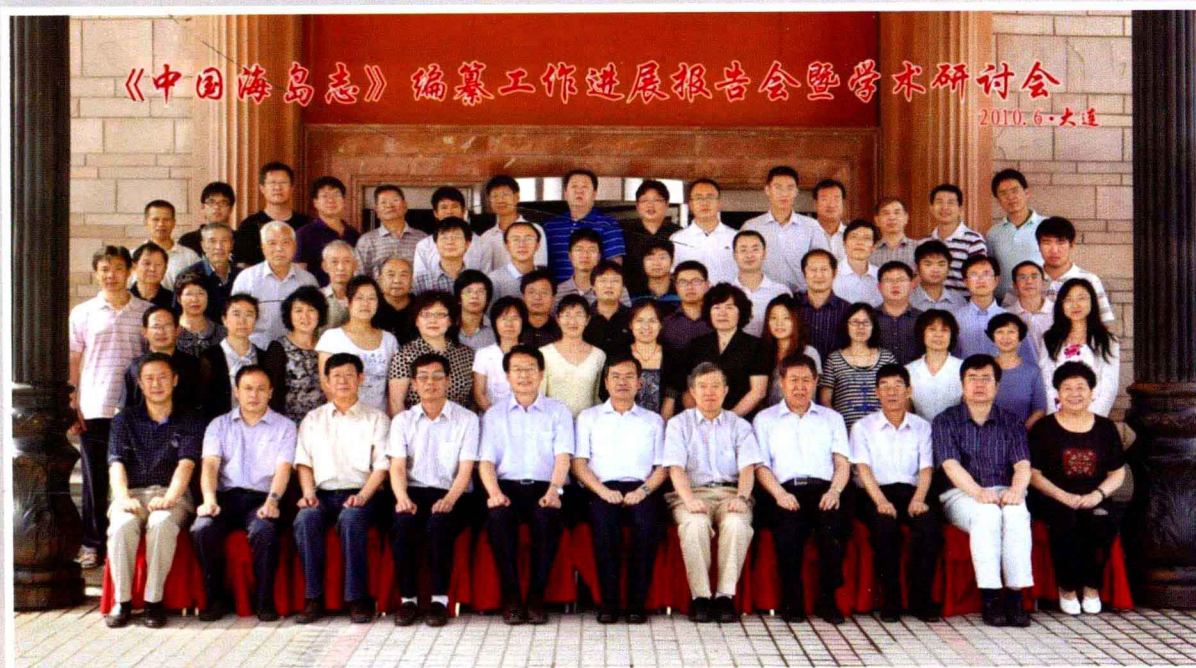
《中国海岛志》编纂工作进展报告会暨学术研讨会与会人员