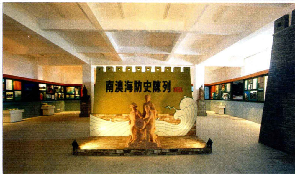
南澳海防史陈列