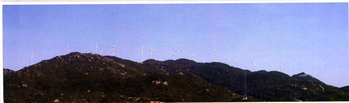
南澳岛风能发电场 (2010年摄)