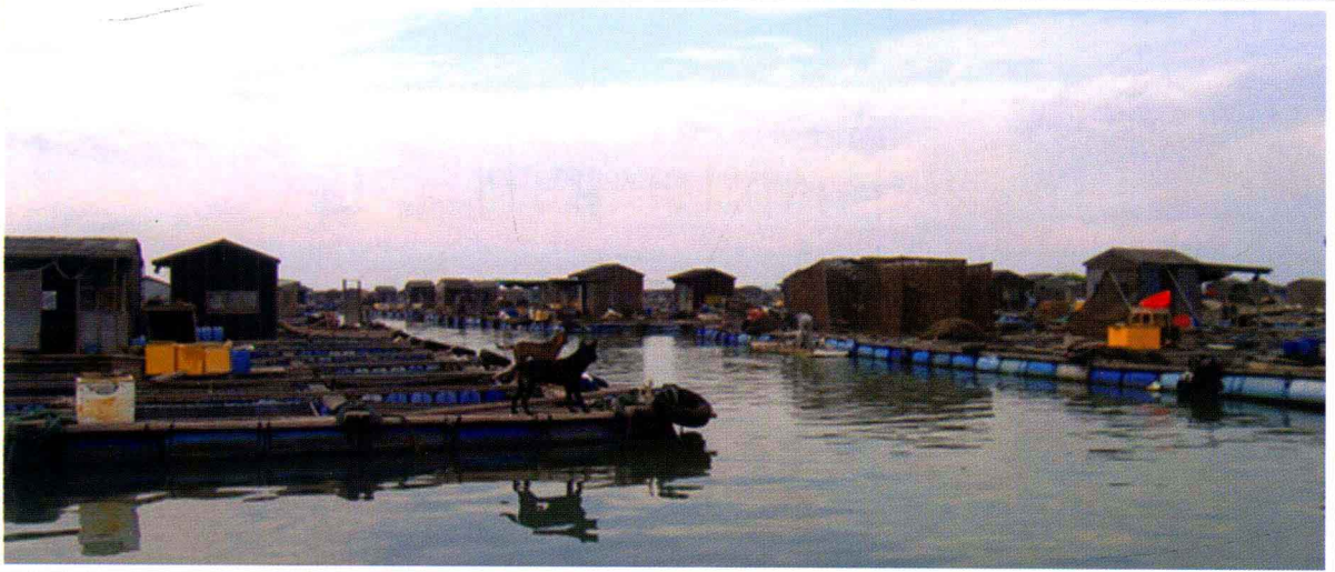
海山岛至汛洲岛海域网箱养殖基地（2008年摄）