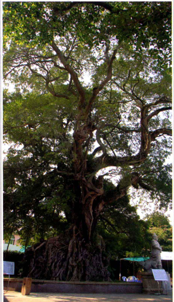
南澳岛郑成功招兵树