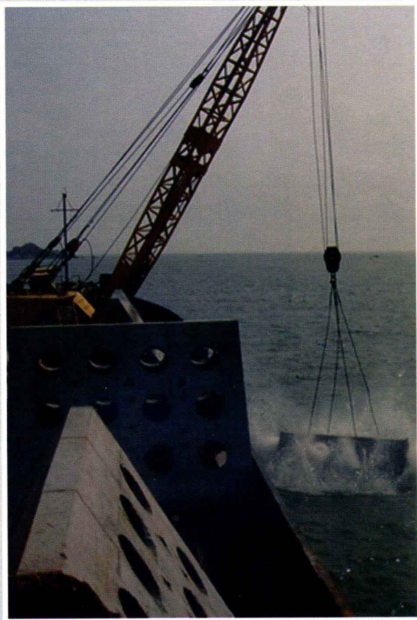
达濠岛海域施放人工鱼礁现场