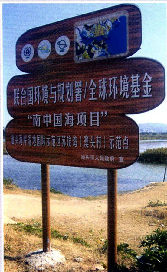
汕头海岸湿地国际示范区达濠岛苏埃湾示范点 (2009年摄)