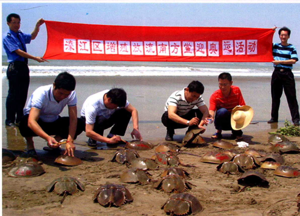
濠江区海洋与渔业局在达濠岛增殖放流南方鲎（汕头市濠江区海洋与渔业局2008年供）