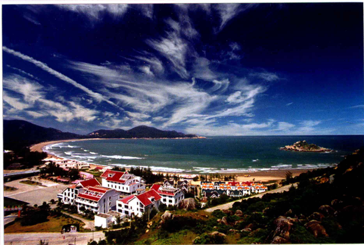
南澳岛青澳湾