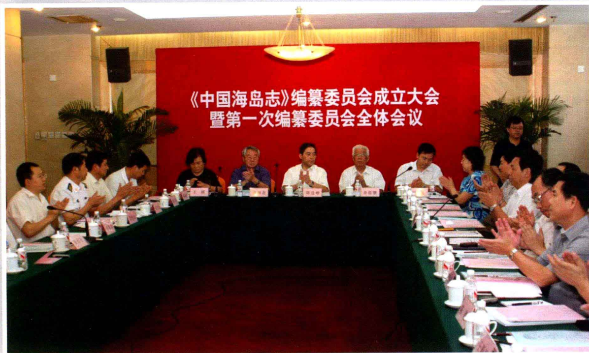
《中国海岛志》编纂委员会成立大会会议现场