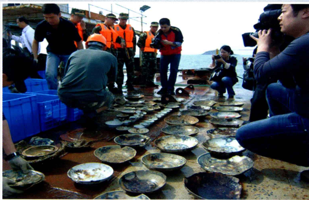
明代古沉船“南澳一号”出水文物 (南澳县海防史博物馆2010年供)