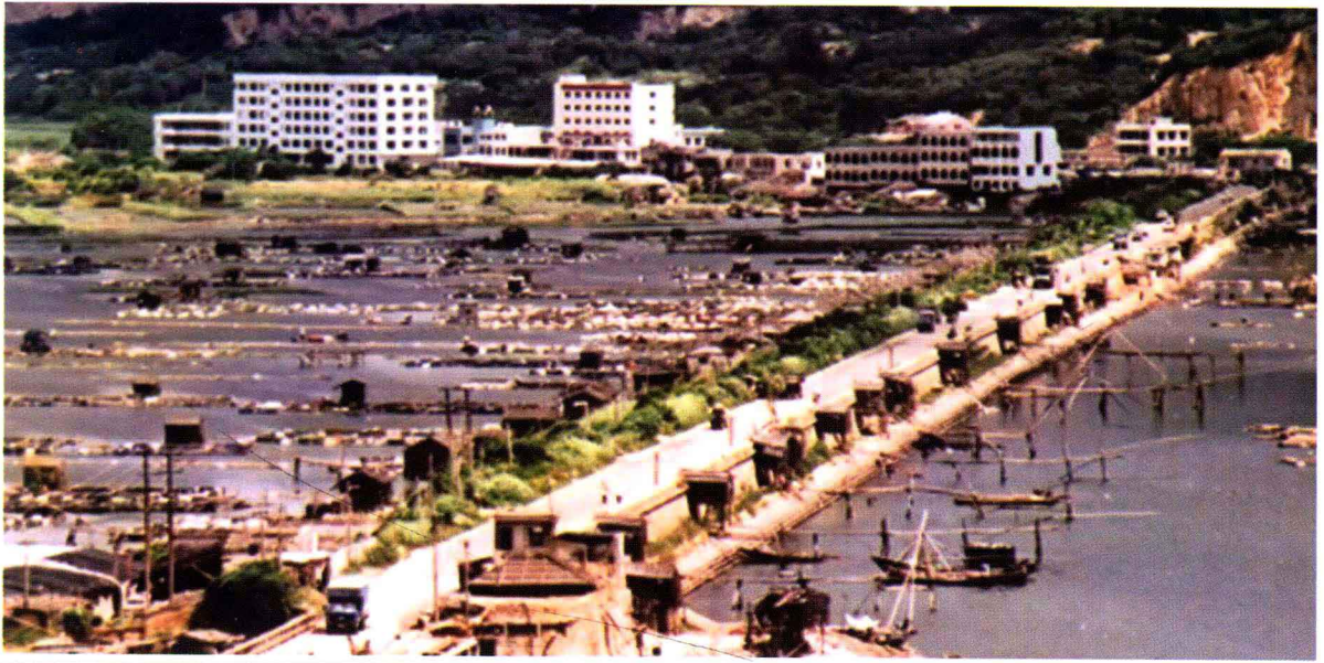
连接海山岛的三百门拦海大提