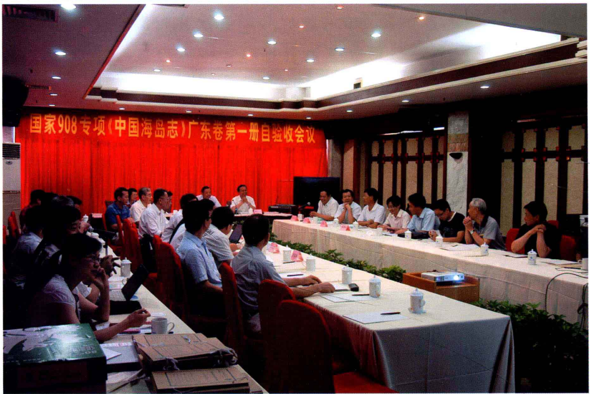
《中国海岛志》广东卷第一册自验收会议 (2011年6月摄)