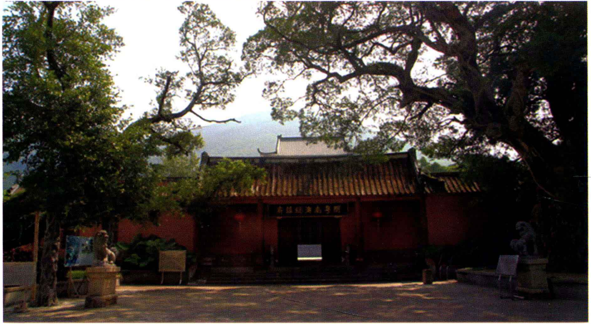
南澳岛郑成功总兵府