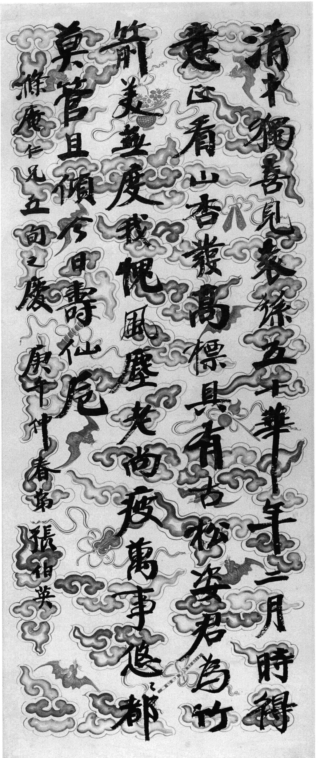
楷書·書贈滌庵先生