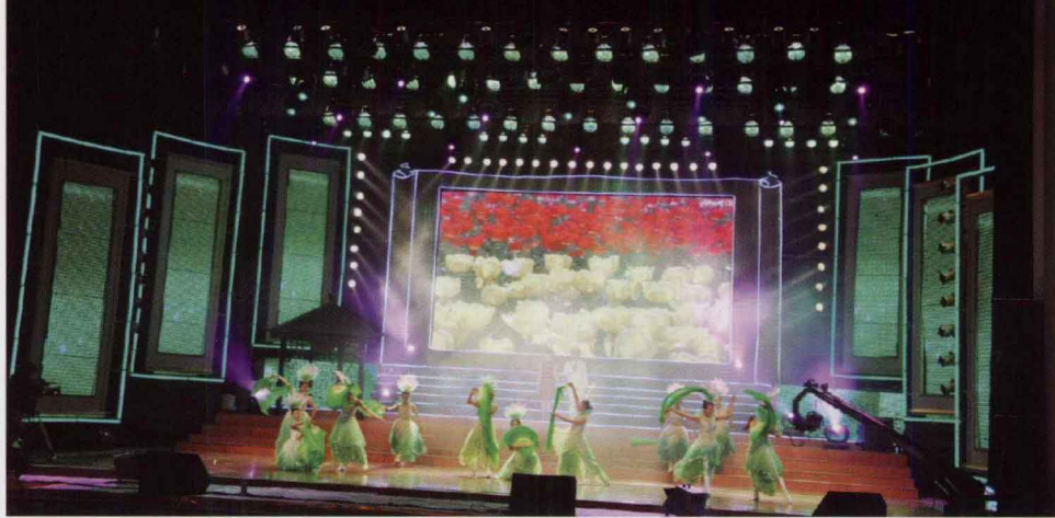
书法兰亭奖颁奖典礼