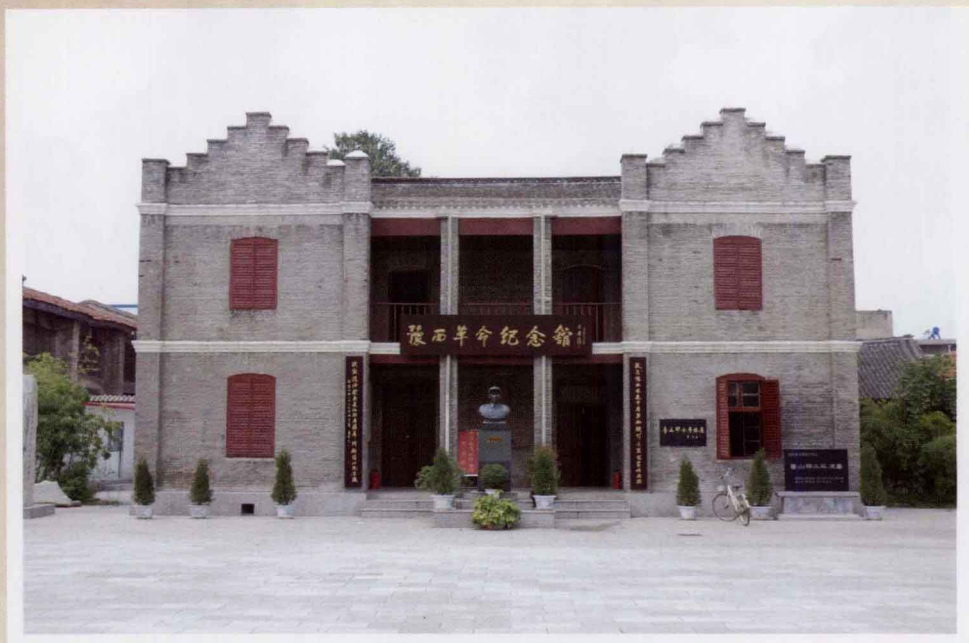
鲁山豫西革命纪念馆