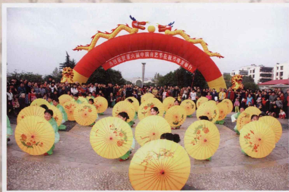
第六届中国曲艺节群众文化活动