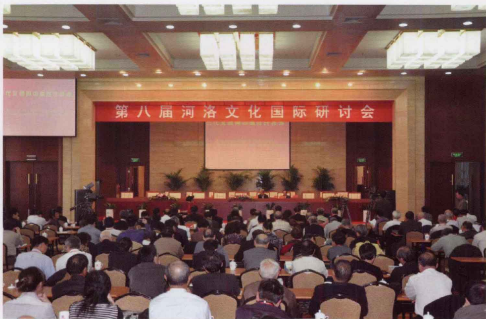
第八届河洛文化国际研讨会会场