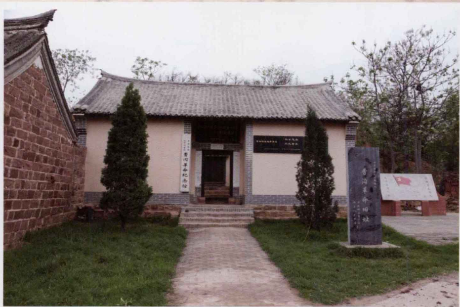
宝丰曹沟革命旧址