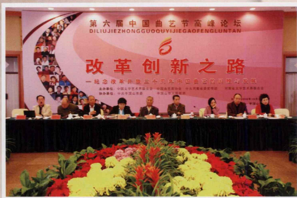
第六届中国曲艺节高峰论坛