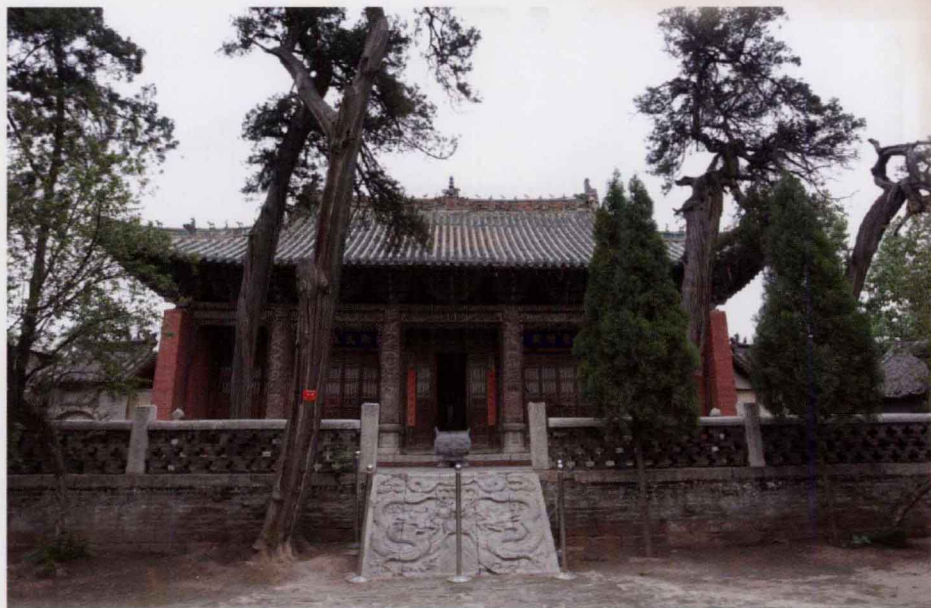
豫陕鄂五专署旧址——郟县文庙