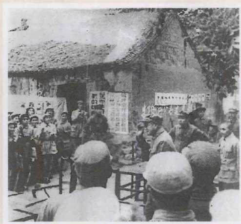
1948年8月2日，刘伯承宣布中原大学成立