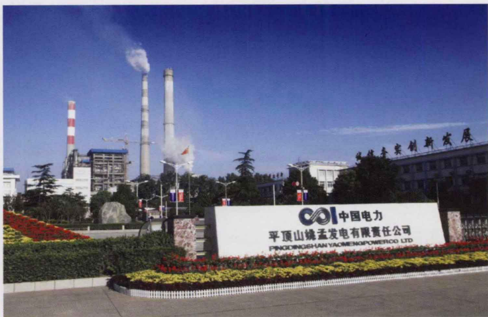
平顶山姚孟发电有限责任公司