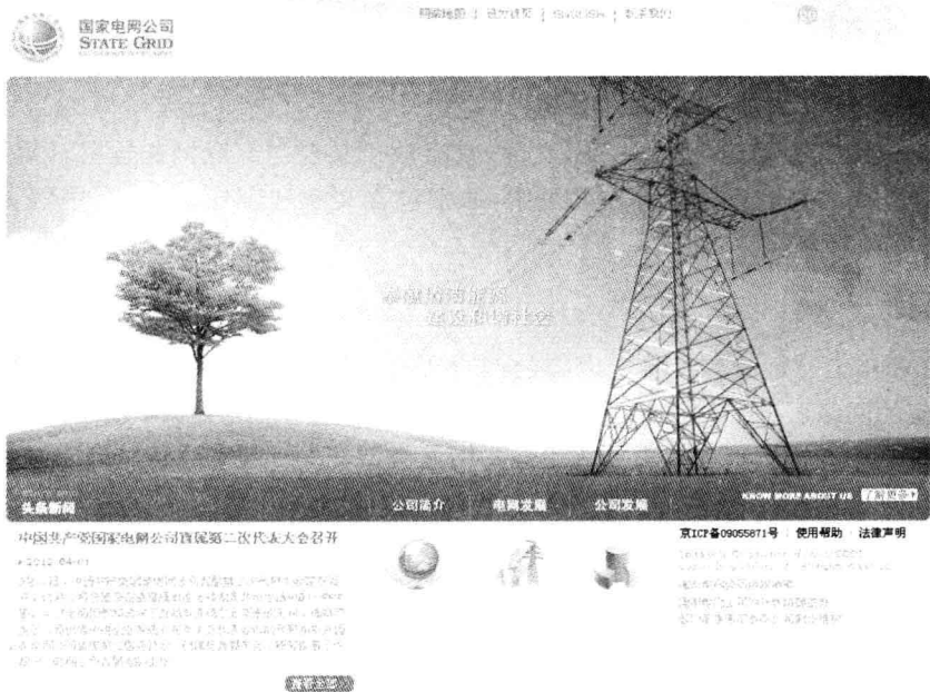
图 1-2 企业型网站(国家电网)

本信息,如图 1-2 所示。这类网站通常以成熟稳重风格出现,能够让浏览者感觉到信任感和安全感。