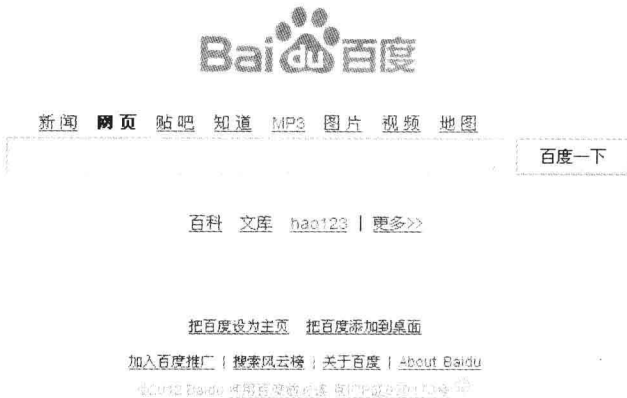
图 1-5 搜索型网站(百度)

搜索型网站是专业为用户提供搜索服务的网站,通常页面设计非常简单,突出强调了用户的体验度,如图 1-5 所示。