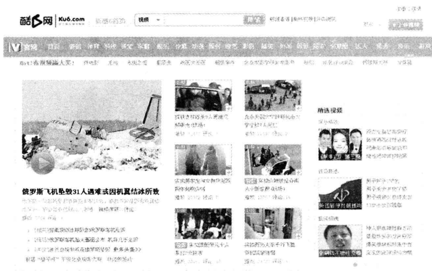
图 1-4 音视频型网站(酷 6 网)

音视频型网站指的是以推荐音乐和视频为主要业务的网站,例如优酷网、酷 6 网、爱奇艺和迅雷看看等。此类型的网站一般采用左右纵览结构,以方便罗列各种音视频资源,如图 1-4 所示。