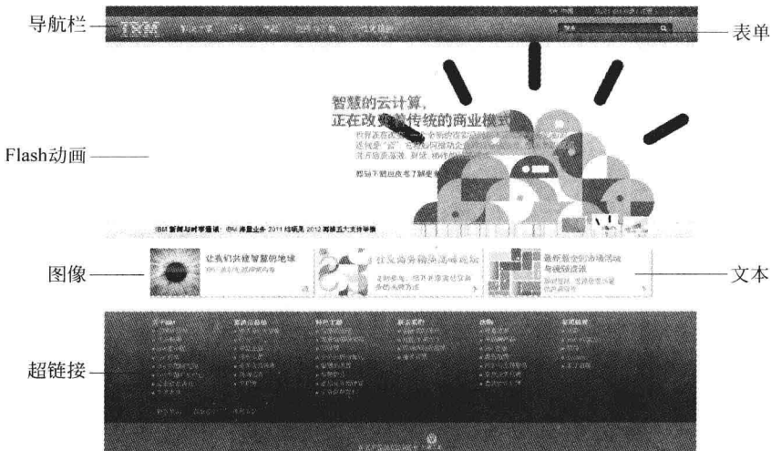
图 1-6 某教育机构网站主页

无论何种类型的网页或多或少都包含以下基本元素:文本、图像、视频、音频、超链接、表格、表单、导航栏和动画等,如图 1-6 所示。