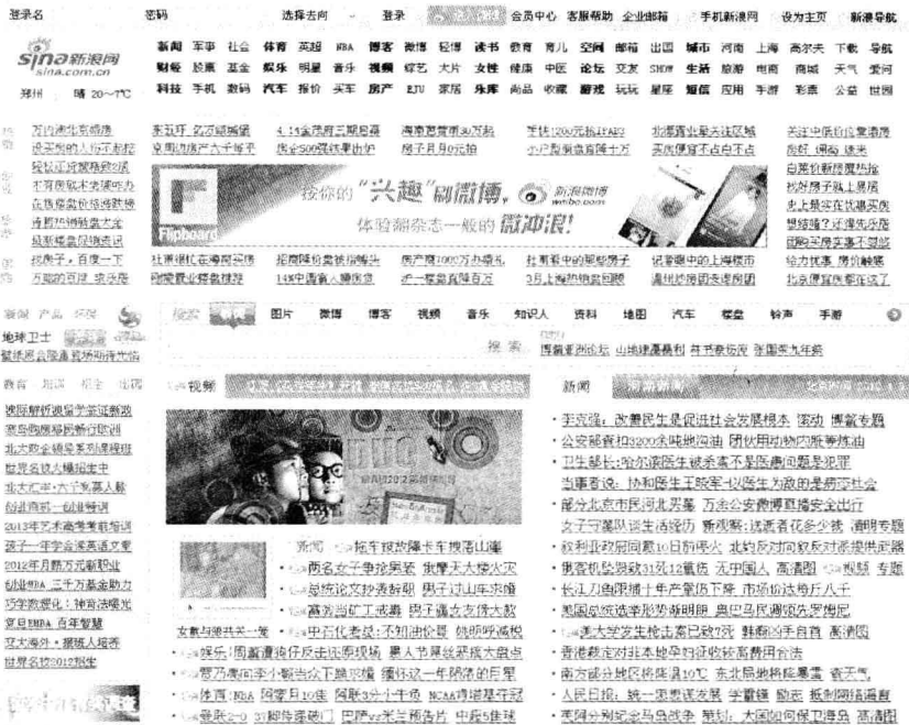
图 1-1 门户型网站(新浪网)

本信息,如图 1-2 所示。这类网站通常以成熟稳重风格出现,能够让浏览者感觉到信任感和安全感。