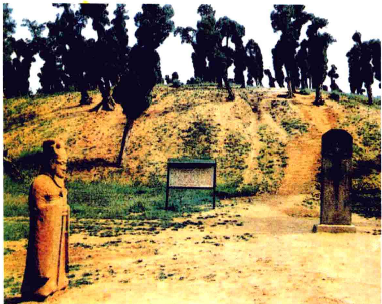
东汉光武帝刘秀陵