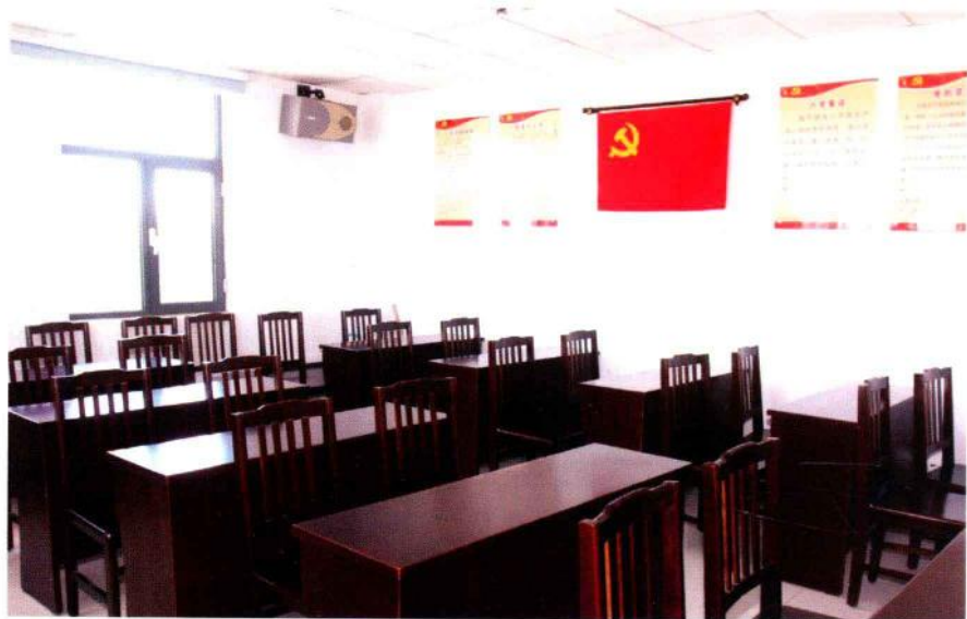
社区党员学习活动室