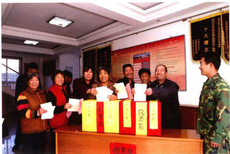
社区居民行使民主权利