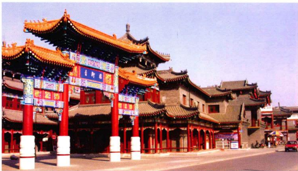
中国年版画之乡——西青区杨柳青新貌