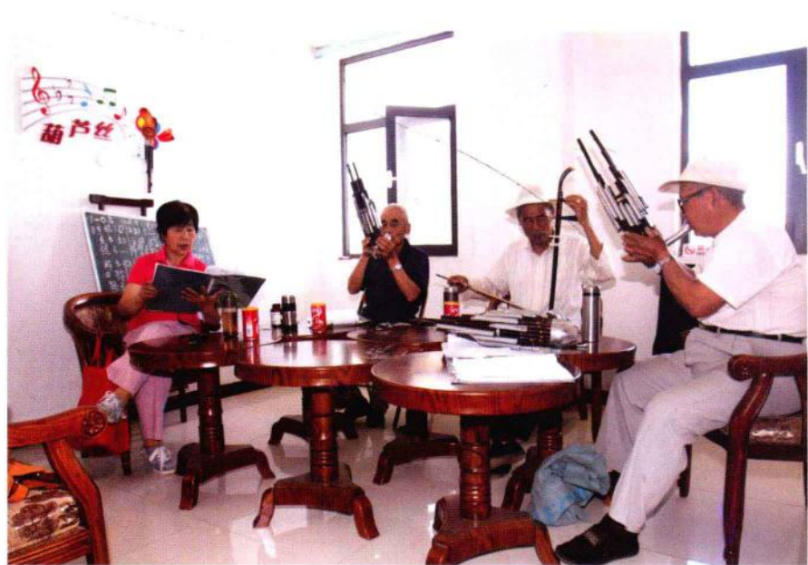
生活富裕的农民自娱自乐