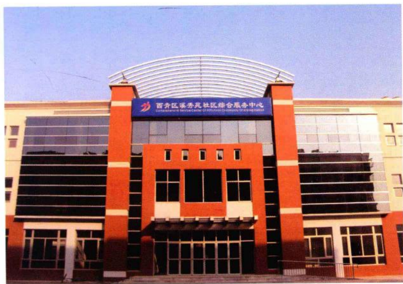
溪秀苑社区综合服务中心