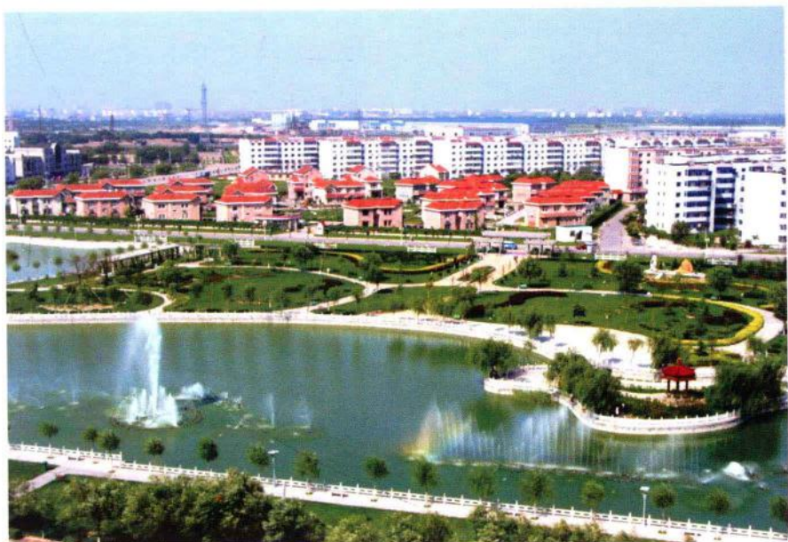
西青区社区景色怡人