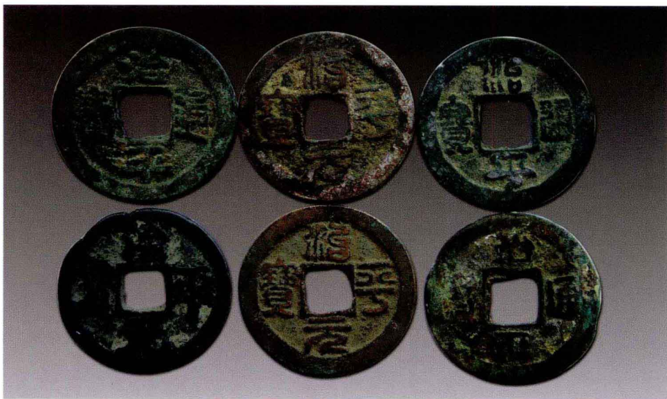
治平通宝和治平元宝

中国古代方孔圆钱，大多以“通宝”、“元宝”、“重宝”命名，以年号或非年号、国号或朝号为名，我们将这类钱币统称为“宝文钱”。“宝文钱”又分年号钱和非年号钱两种。非年号钱，顾名思义就是不以国号、年号为名的钱。