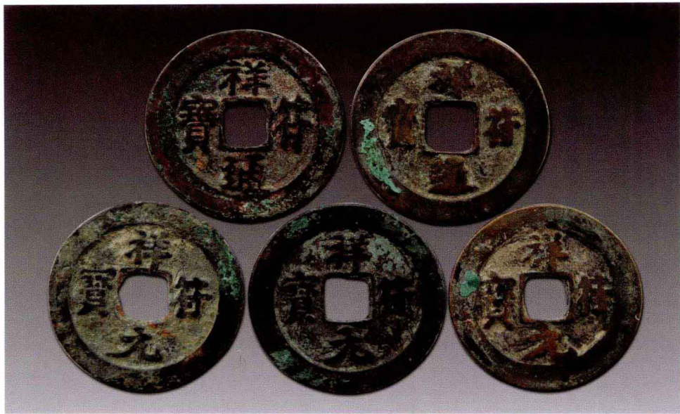
祥符通宝和祥符元宝