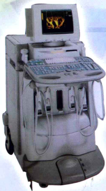
日本岛津 SDU-1200 彩超