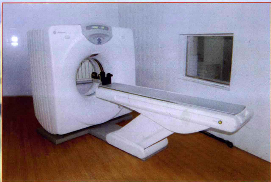
美国 GE 高档螺旋 CT