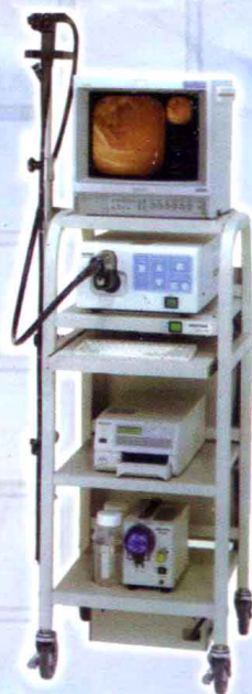
日产潘太克斯电子胃镜