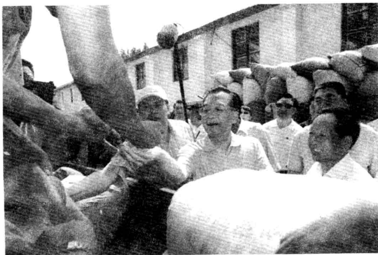
2006年7月15日，温家宝总理（前排中）