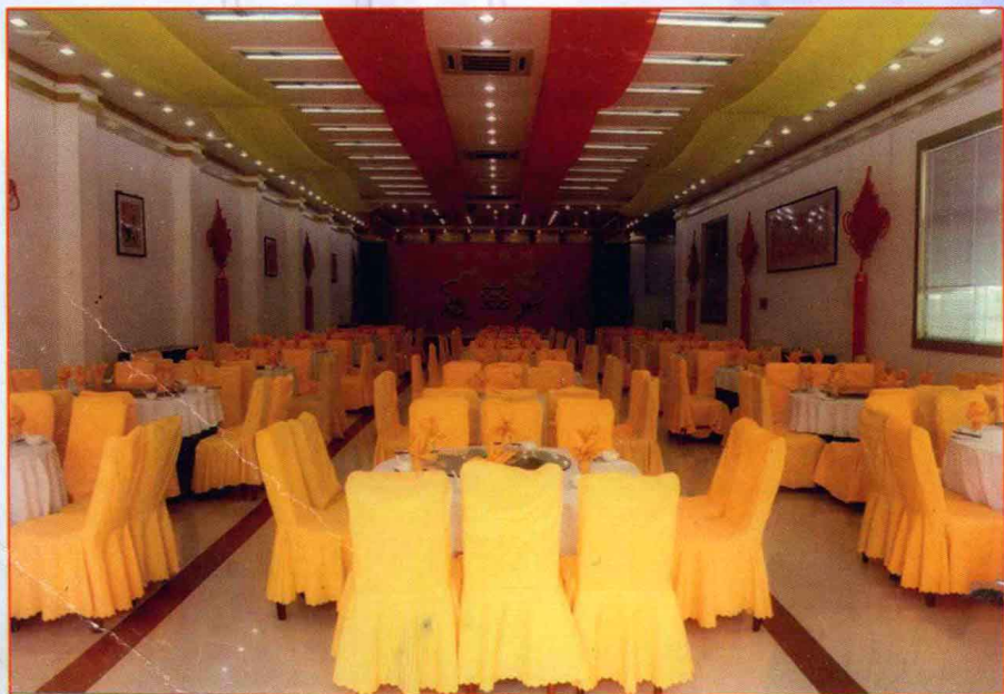
宽敞舒适的宴会厅