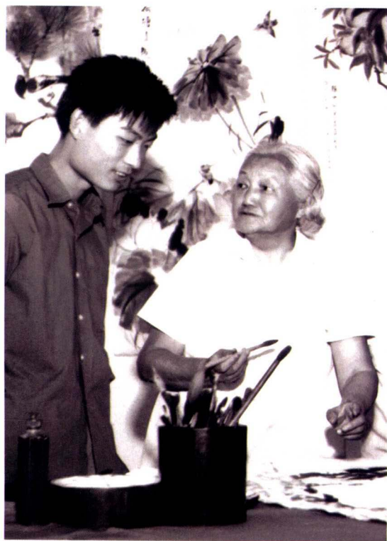
恩師向作者傳授技藝