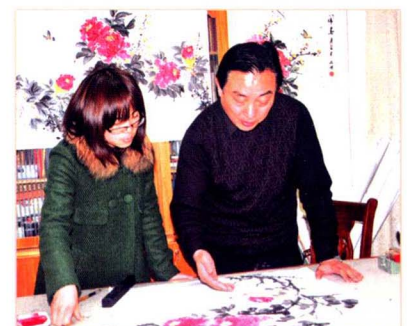
作者向學生傳授技藝