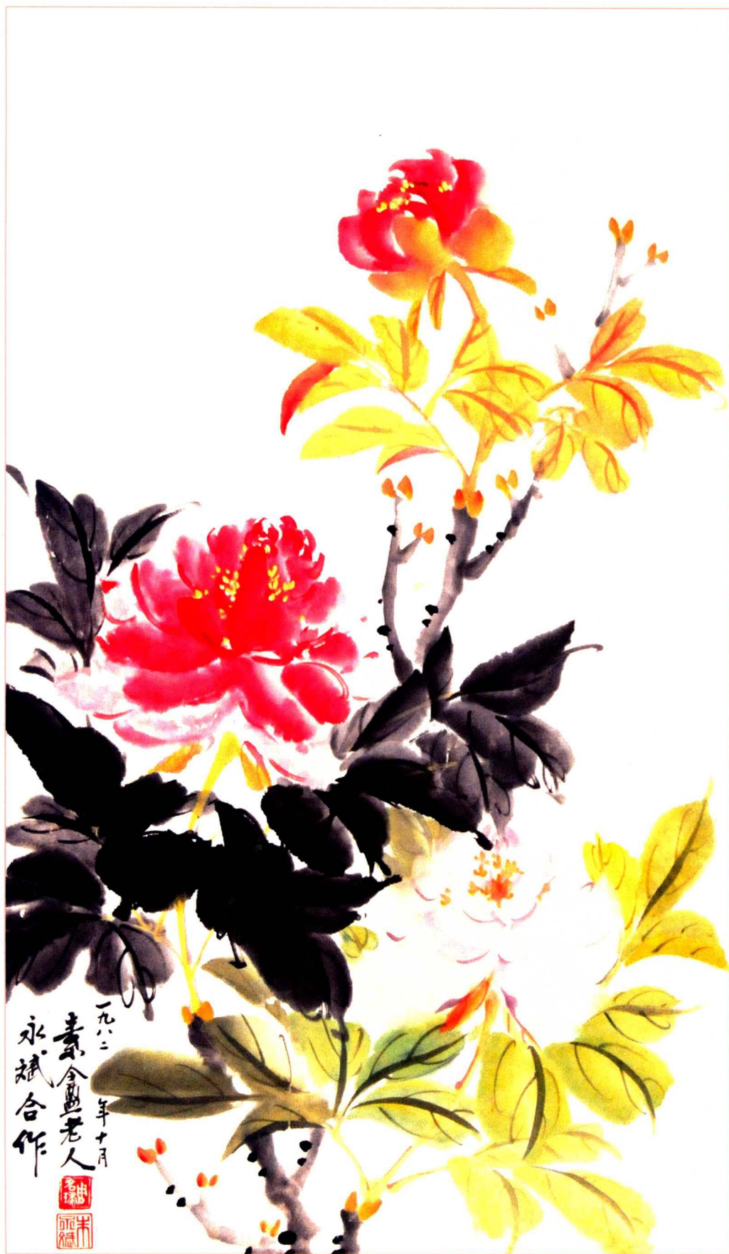
《牡丹圖》（周名球、朱永斌合作） 67cm×39cm