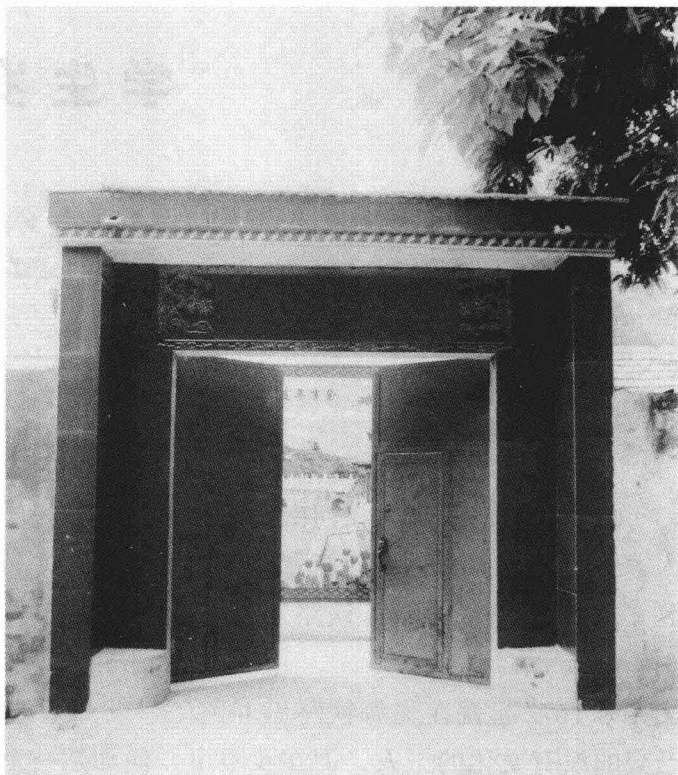
我的出生地：夏邑县季纪庄村老宅现貌

父亲对我们影响最大的，是他经常说的：“你们要上学，没文化不行”，“公家的事不能马虎，公家的便宜决不要沾”，“对朋友不能亏待，做事不能让朋友吃亏。”