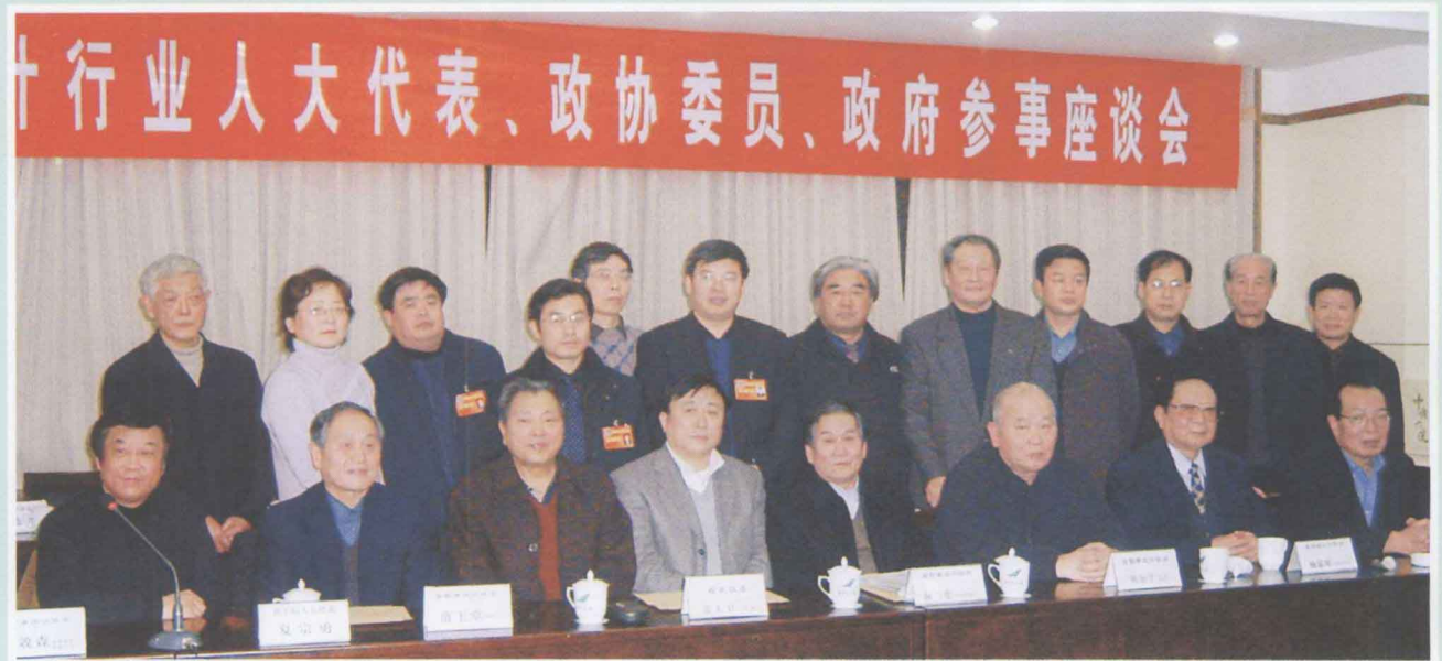
▲ 河南省勘察设计协会每年在省召开人大、政协会议期间，都要召开行业人大代表、政协委员、政府参事座谈会。通报行业情况和协会工作，并就行业体制改革问题，以人大代表、政协委员的名义向“两会”提出建议、提案，推动行业体制改革。图为2006年1月14日协会召开的有副省长张大卫（左四）、省人大常委会原常务副主任 钟力生 （右四）、省政协原常务副主席姚如学（右三）参加的座谈会，会后有关领导与代表、委员、参事等合影。