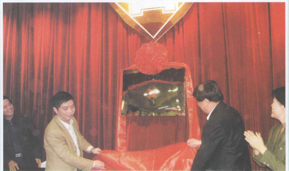
▶ 河南省建筑设计研究院，是省建设厅改革试点单位，也是省直较好完成改制单位之一。图为该院举办新公司揭牌仪式。