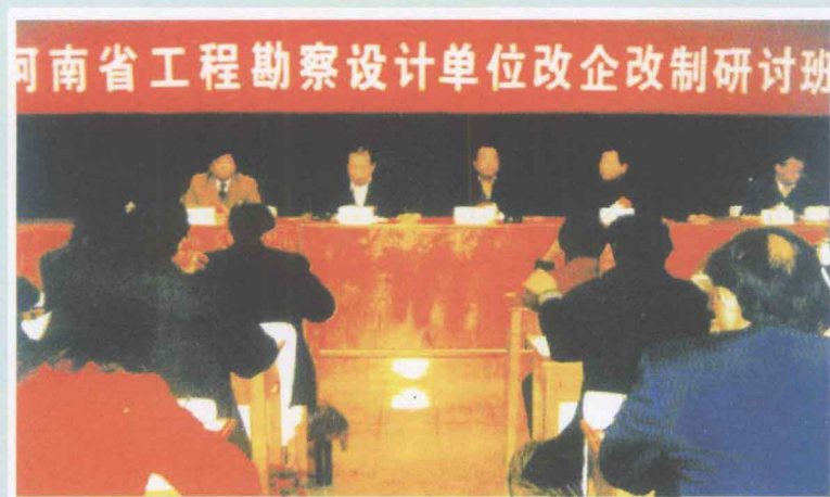
◀ 2004年3月22日至24日，协会举办全省工程勘察设计单位改企改制研讨班。中国勘察设计协会时任理事长吴奕良先生亲临河南讲学，在研讨班上作了体改专题报告。图为吴奕良（正中）、省发改委副主任范保国（左二）在研讨班主席台就座。