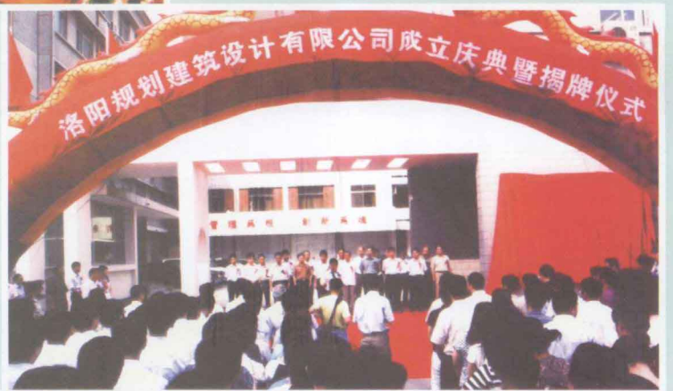
▶ 洛阳规划建筑设计有限公司 举行公司成立庆典暨揭牌仪式。