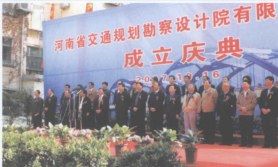
▶ 河南省交通规划勘察设计院有限责任公司举办成立庆典大会。