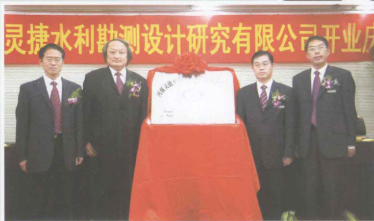
◀ 河南灵捷水利勘测设计研究 有限公司举行开业仪式。