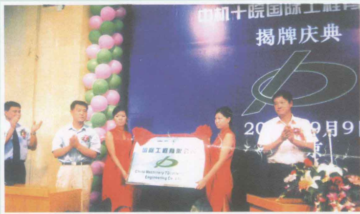
◀ 中机十院国际工程有限公司 举行公司揭牌仪式。