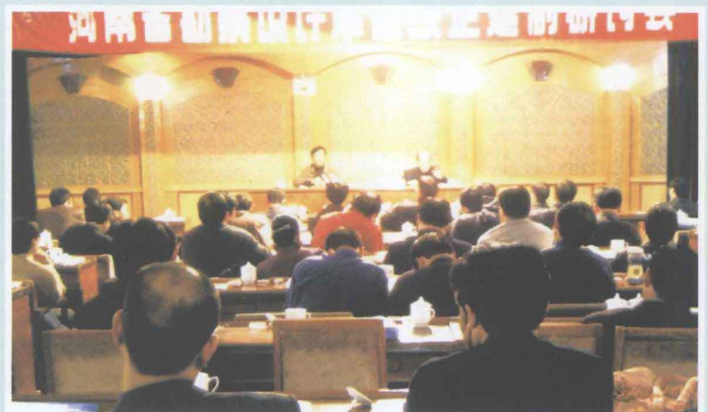
▶ 2003年11月10日至12日，协会在焦作市举办工程勘察设计单位改企改制研讨会。协会思想政治工作委员会、经营管理工作委员会、财会专业委员会、勘察专业委员会成员单位有关人员参加了研讨。省水利、化工、交通、电力、中机十院、中讯邮电、洛阳石化、平顶山选煤院、黄委设计院以及南阳水利院等交流了改企改制的思路和经营管理工作经验。