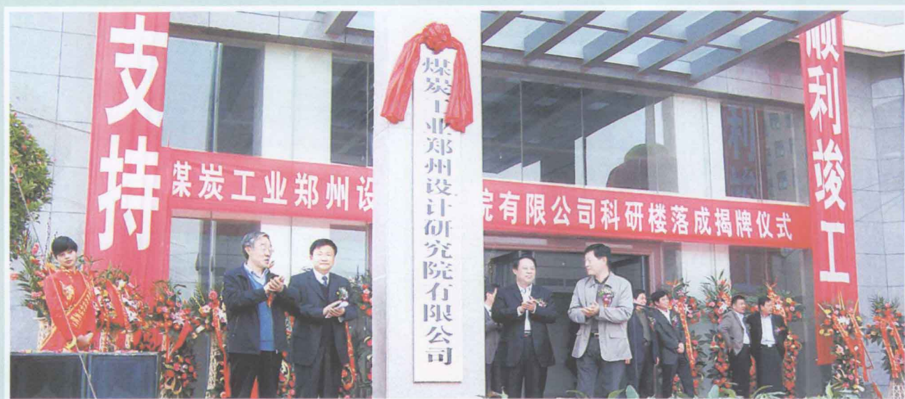
▲ 煤炭工业郑州设计研究院有限公司举办公司科研楼落成暨公司揭牌仪式。