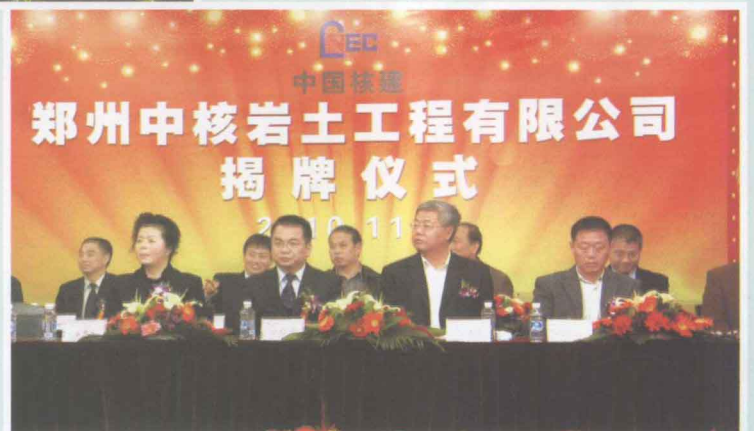
▶ 郑州中核岩土工程有限公司 举行公司揭牌仪式。