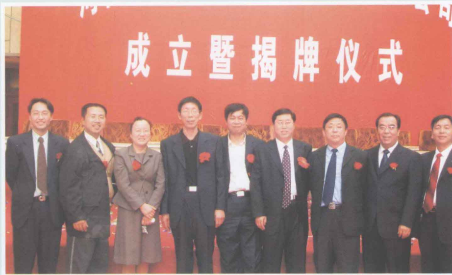
▶ 河南省水利勘测设计院，是省水利厅改革试点单位，是省直最早完成改制单位。图为公司董事会、监事会成员在新公司成立暨揭牌仪式上留影。