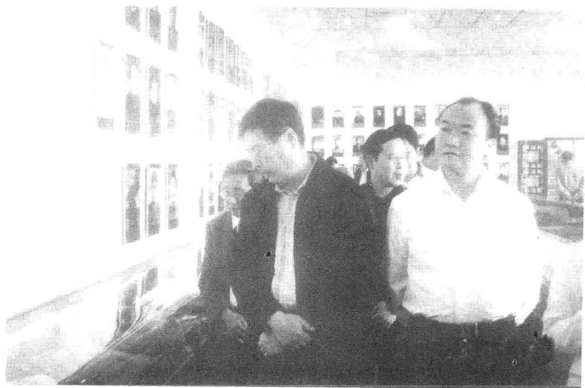
全国政协副主席黄孟复（左）在中共巴中市委书记李仲彬（右）、中共巴州区委书记廖伦志（中）的陪同下视察将帅碑林。