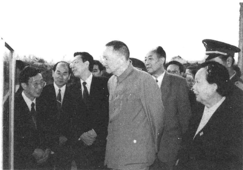
全国政协副主席洪学智上将（中）偕夫人张文（右，副军，通江人）视察将帅碑林。