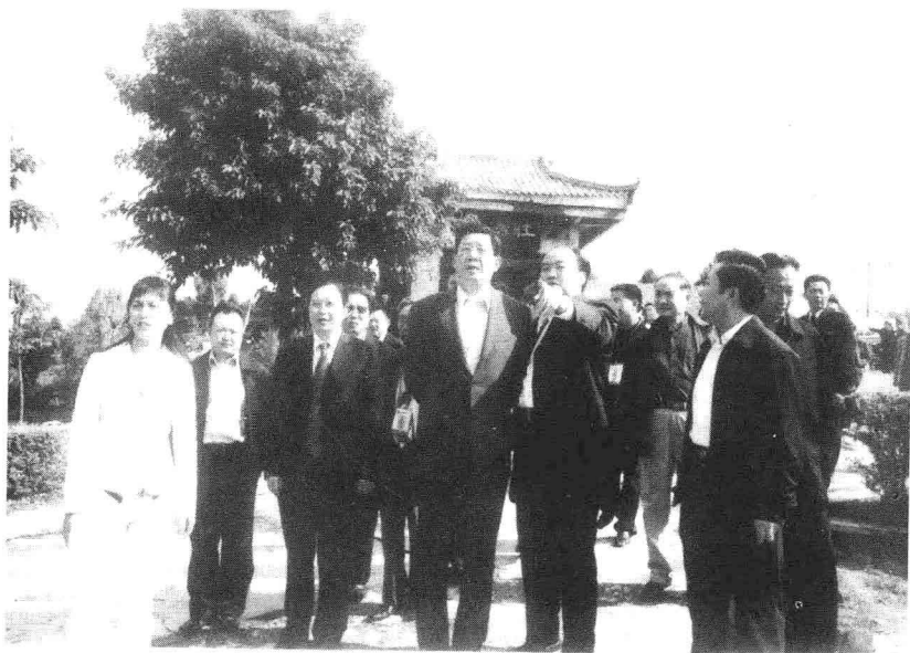
劳动保障部副部长胡晓义（左四）在巴中市委书记李仲彬（左五）、巴州区委书记廖伦志（左三）的陪同下视察将帅碑林。