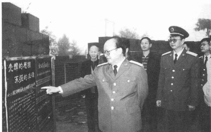
成都军区政委刘书田上将（左）在巴中市政府市长熊光林（后中）、巴中军分区司令员周泽政（右）的陪同下视察将帅碑林。