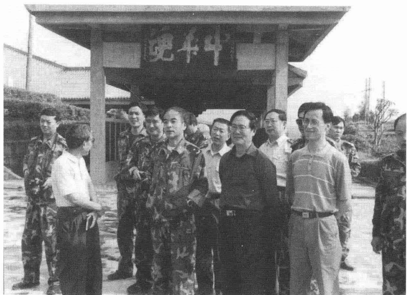
空军副政委刘亚洲将军（前右三）视察将帅碑林。