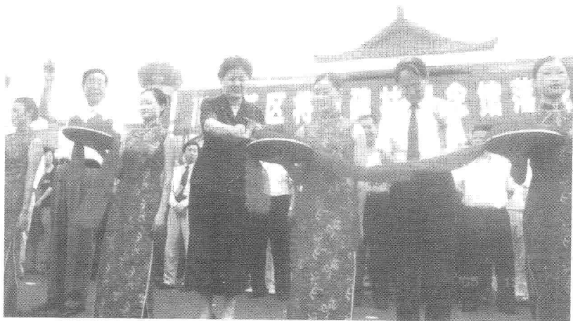
全国政协副主席、中共中央统战部部长刘延东为将帅碑林纪念馆落成典礼剪彩。