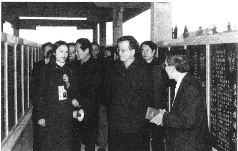
温总理、周书记在碑林长廊内观看红军将士纪念单碑