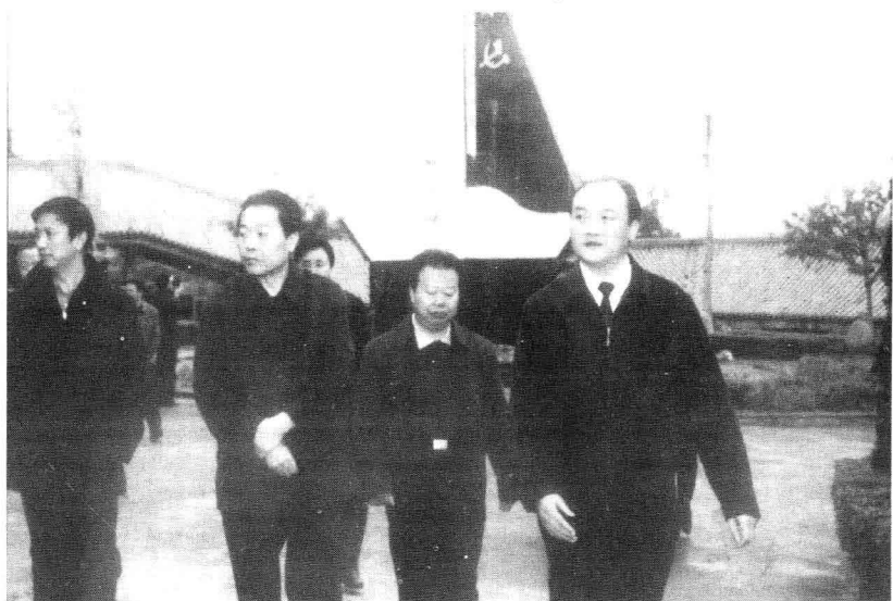
2006年11月24日，中共中央文献研究室主任滕文生（左二）在四川省委常委、宣传部长王少雄（左一），巴中市委书记李仲彬（右一），市委常委、宣传部长李树海（右二）的陪同下考察调研将帅碑林。