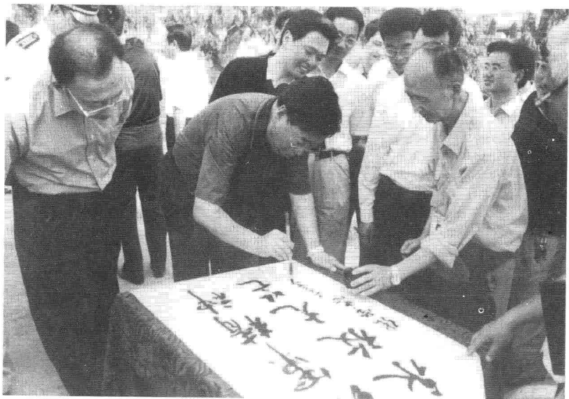
中共四川省委书记张学忠视察将帅碑林时亲笔题书： “红军精神，永放光芒”。