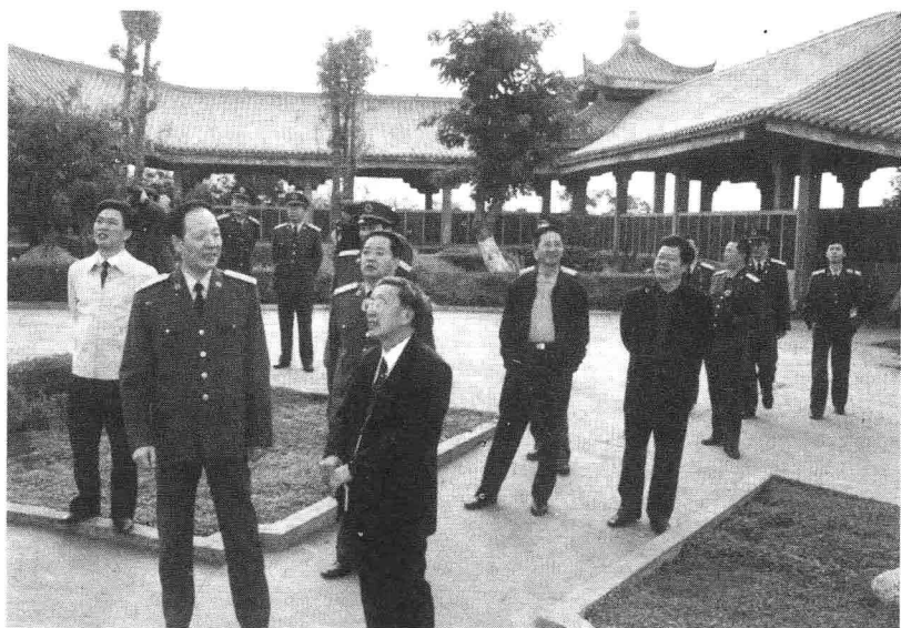
原成都军区政委、现广州军区政委杨德清上将（前左一）在巴中市委书记杨安民、市长熊光林陪同下视察将帅碑林。