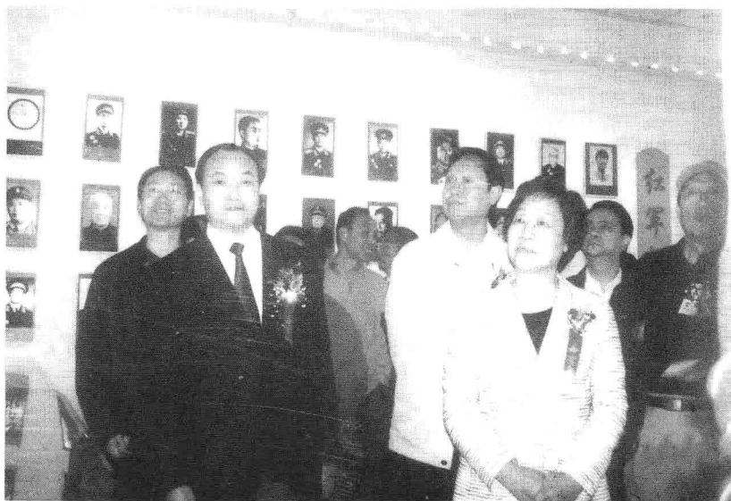
四川省政协主席秦玉琴在中共巴中市委书记李仲彬的陪同下视察将帅碑林。