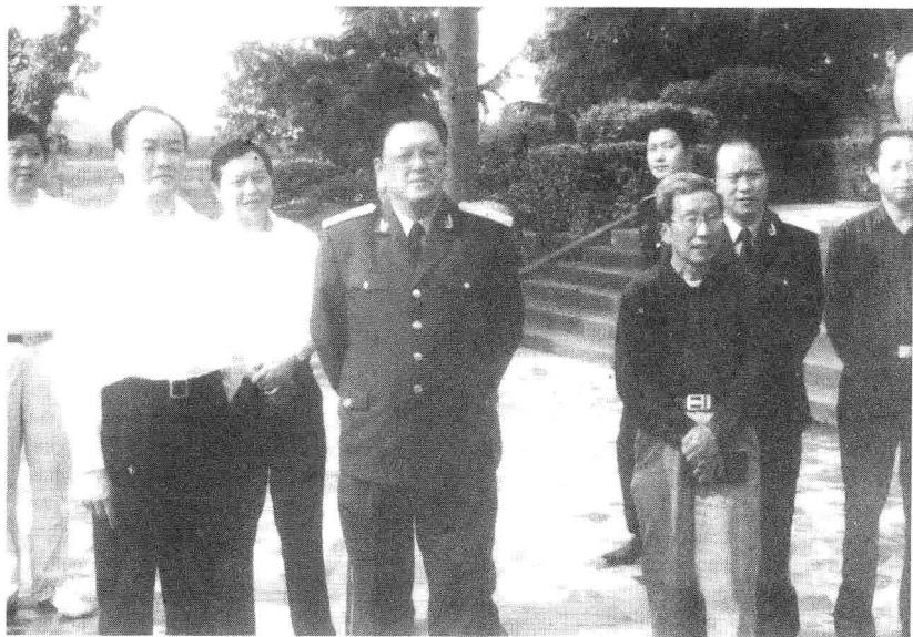
公安部消防局局长郭铁男少将（左四）在巴中市委书记李仲彬（左二）、巴州区委书记廖伦志（左三）、巴州区区长康远奎（右一）的陪同下视察将帅碑林。