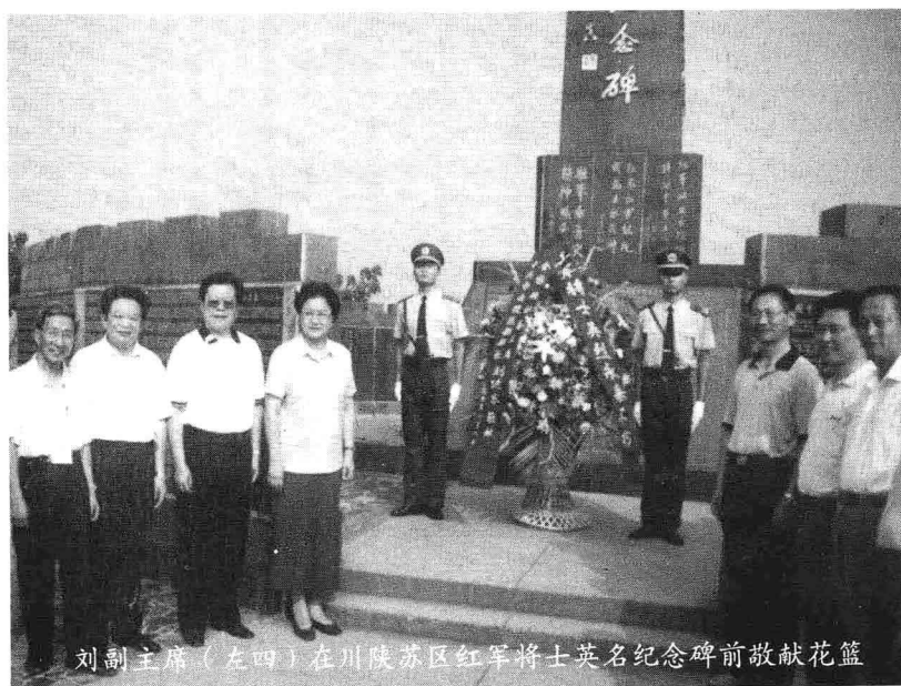
刘副主席（左四）在川陕苏区红军将士英名纪念碑前敬献花篮