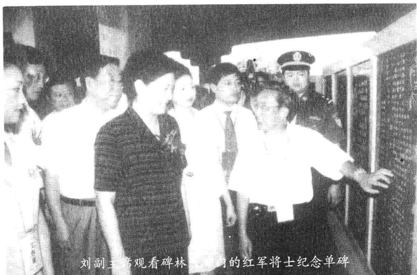
刘副主席观看碑林内的红军将士纪念单碑