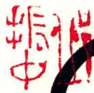
杜牧·华清宫 38.6cm x 25.8cm 2007