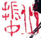
杜牧·江南春 38.8cm x 25.9cm 2007