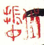
李涉·宿武关 38.6cm x 26.8cm 2006