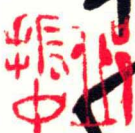
龚自珍·梦中作四截句之一 38.4cm x 25.4cm 2007