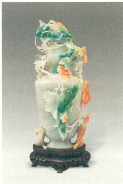
◎ 翡翠三秋瓶 1958年 ◎

新中国成立以来，北京市政府十分重视北京特种工艺美术的发展，采取了许多重大措施，恢复了老北京的传统工艺。已经改行的玉雕艺人纷纷归队，重操旧业，经历了参加玉雕生产合作社到进大型艺术工厂——北京玉器厂的转变，北京玉雕获得了空前的发展。北京玉雕从业人员多，技艺全面，产品的风格特点和制作技艺在中国玉雕行业中独树一帜。1981—1989年，国家经贸委与轻工业部联合举办了九届中国工艺美术品