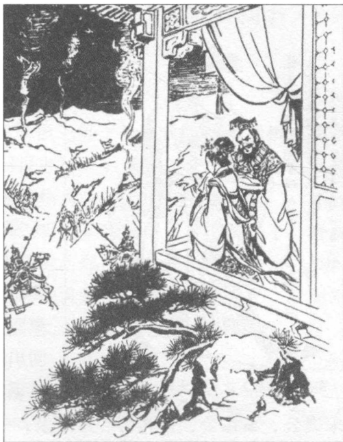
亡掉西周之烽火戏诸侯

④春秋社洛邑讯 周幽王烽火戏诸侯，结果在西戎来攻镐京的时候，没几个诸侯来帮忙，周幽王自己也被西戎军杀害，然后就是西戎对镐京的抢掠。周平王即位后，镐京已无法再成为一个王国的首都，于是新的周王朝将首都从镐京迁到洛邑。这也意味着在中国历史上，西周时代终结，东周时代开启。这一年，是公元前770年。