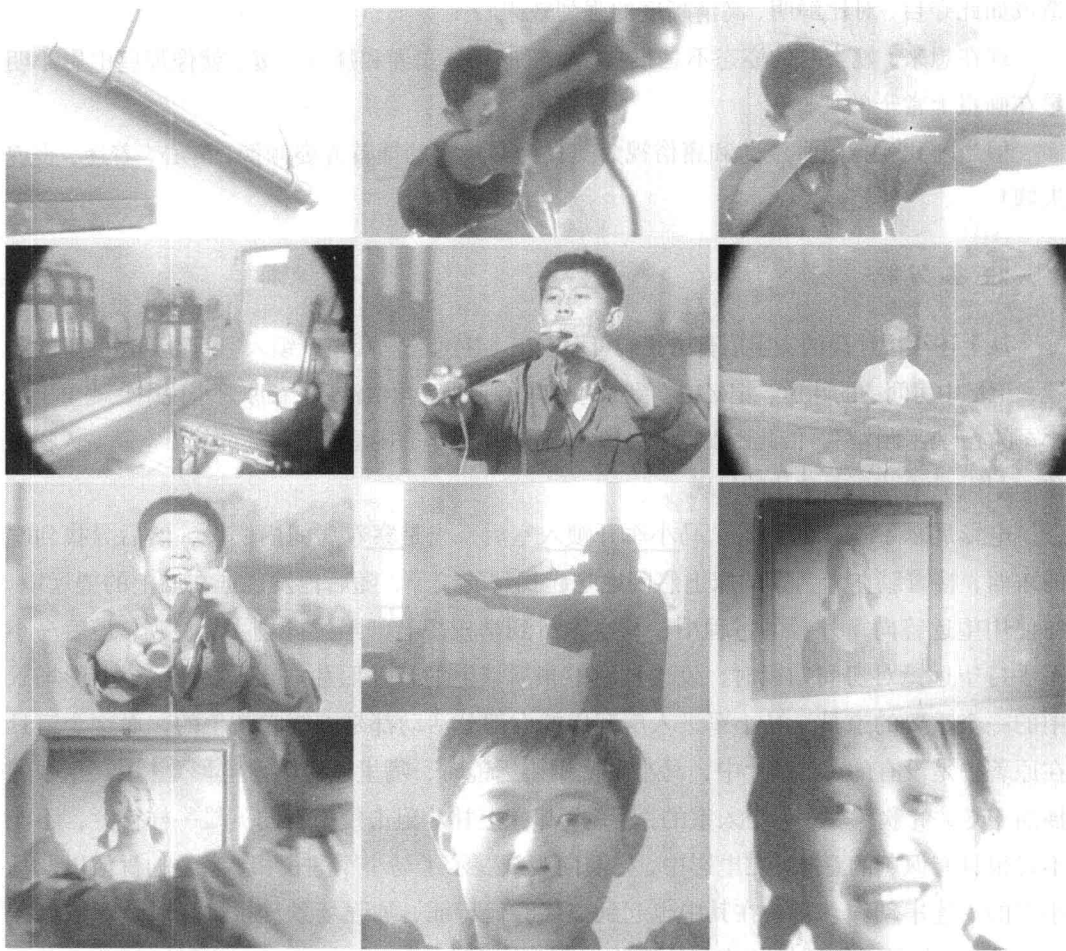
图1-1 电影《阳光灿烂的日子》片段