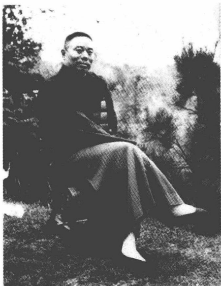
沈氏女科17世传人来字辈