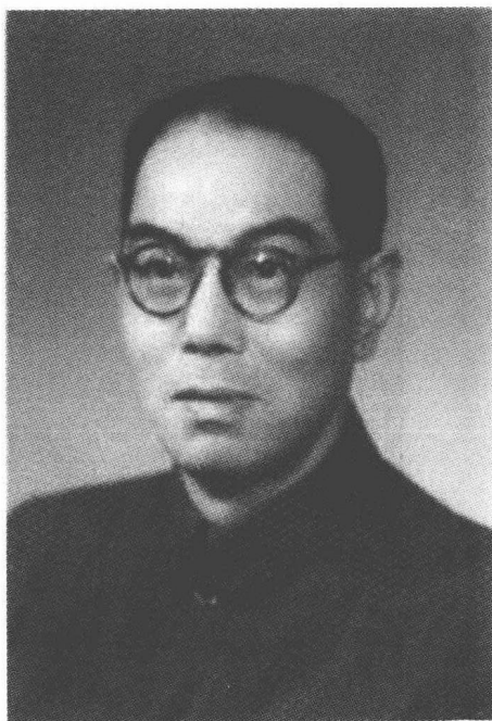
沈氏女科18世传人宗字辈