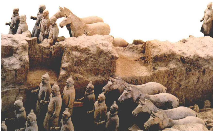
图1-1 秦始皇陵兵马俑1号坑，陕西临潼秦始皇陵兵马俑博物馆

秦始皇兵马俑1号坑面积大约1.4万多平方米，陶俑原都有彩绘，因年代久远，又深埋于泥土中，彩绘基本脱落，现在看到的大多是陶质的原色了。