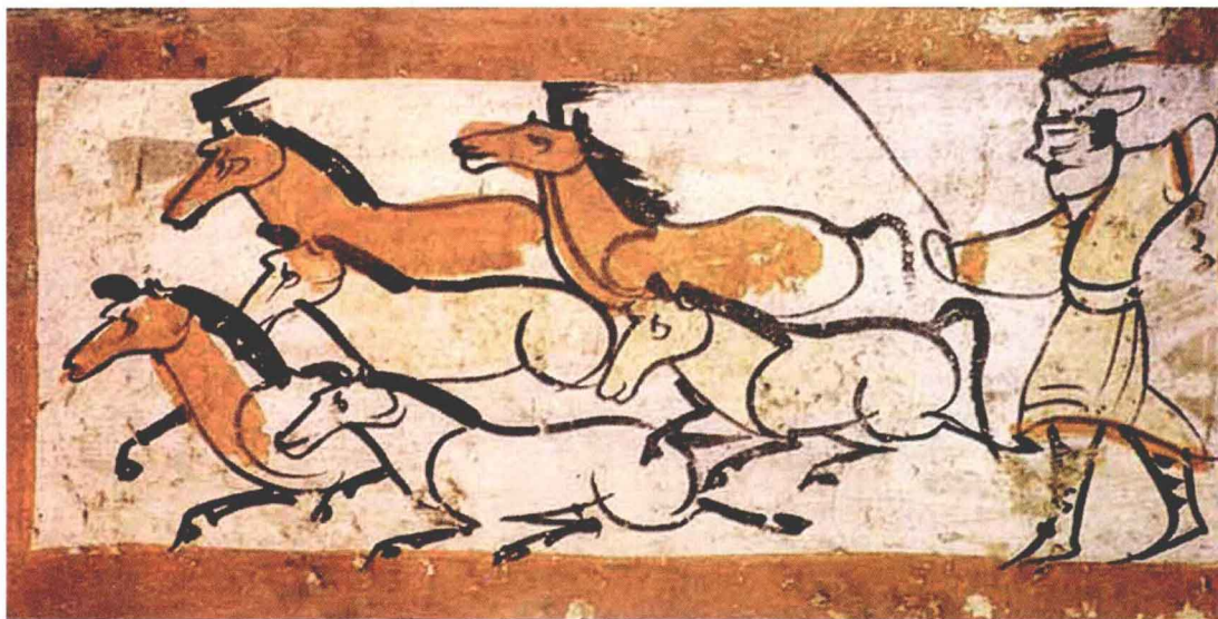
图1-4 [魏晋]《牧马图》(36cm×17cm)，砖画，甘肃嘉峪关魏晋砖墓

甘肃嘉峪关、张掖、酒泉、敦煌一带发现魏晋时期的壁画墓有20余座。画面构图简洁，线条飞动流畅，充满生活情趣。