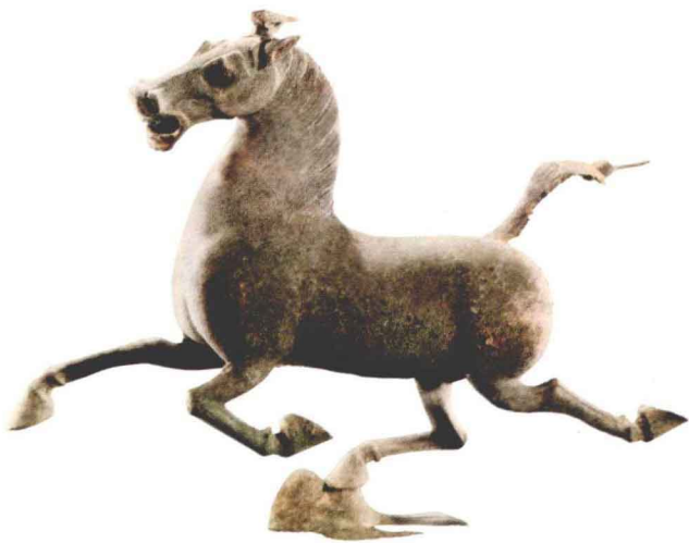
图1-5 [汉]《马踏飞燕》(45cm × 10.1cm × 34.5cm), 青铜,甘肃武威雷台东汉墓,甘肃省博物馆藏