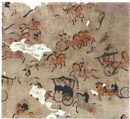
图1-2 [汉]《车马出行图》局部，壁画，内蒙古和林格尔汉墓

马是交通工具，也是人地位的象征。在汉代的墓室壁画和画像石、画像砖中，车马出行是最常见的题材，用来描绘墓主人生前的奢华和显贵。内蒙古和林格尔汉墓的《车马出行图》（图1-2），是迄今发现的汉墓壁画中图幅和榜题保存最多的一处，有100多平方米。内容丰富，场面宏大。壁画主要通过各种出行图来表现墓主人的仕途经历。共有文武从吏、从卒和随员128人，马129匹，各种车辆10乘。构图疏密有致，线条充满动感和力量。几条圆转有力的弧线（图1-3），使体魄强健充满原始魅力的马跃然出壁，在苍茫的草原上自由奔驰。车轮滚滚，骏马嘶鸣，