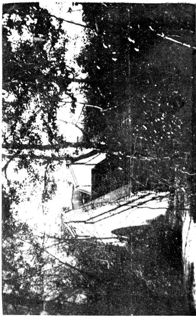
廣州荔枝灣風景之一