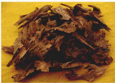
越南芽庄虫漏沉香

第三种就是由于动物、台风等原因造成树木枝干折断在断口处结香，原理是一致的，可以认为是生结，也就是说，生结必须是外力损伤树木后结香的。