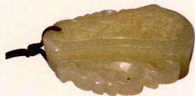
明代凤鸟纹玉香囊