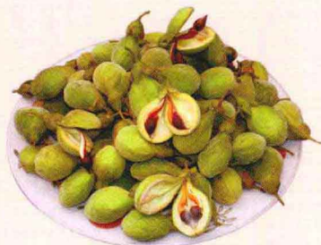
沉香树果实似梨形，长约4厘米，宽约3厘米，厚约2厘米

交趾蜜香树，彼人取之，先断其积年老木根，经年，其外皮干俱朽烂，木心与枝节不坏，坚黑沉水者，即沉香也。半浮半沉与水面平者为鸡骨香。细枝繁实未烂者为青桂香。其干为栈香。其根为黄熟香。其根节轻而大者为马蹄香。此六物同出一树，