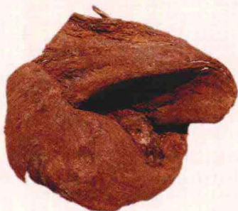
越南芽庄纯天然香材