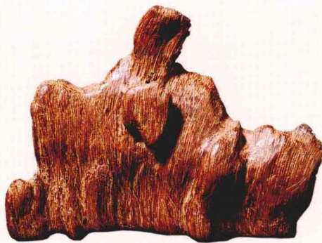
越南芽庄熟结黄土沉香山子

米，这样就使得伤口内逐渐分泌出油脂，渐渐结香。结香时间越长，香品质就越好。取香之后又成新的伤口，仍会继续结香。 半断干枝的办法，即香农称的“开香门”或“开香口”。在树干距地1米左右的地方，用锯子锯一伤口，深度根据树干粗细而定，一般不要超过树干粗的三分之一，后用凿子凿一个“门”字形，或凿成马牙形，约8~12个月，伤口就会结香。一般一棵香树同时不能多过三个香口，并要在不同方向开。