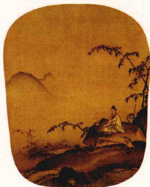
【宋】马远·《竹涧焚香图》