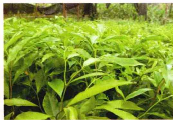
人工培育的沉香苗