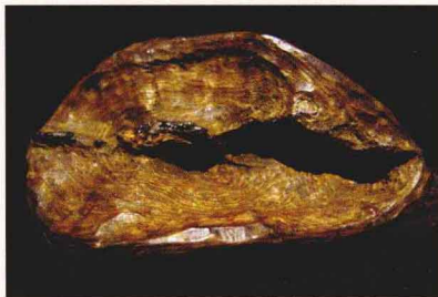
越南芽庄脱落结沉香

香农依据长期以来的经验，对怎样判断香树是否结香可总结成三句话：“有伤疤有树瘤就有香”，“有虫蚁有洞口就有香”，