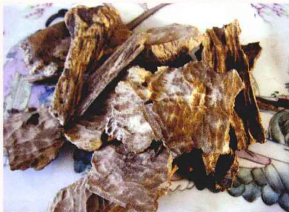
越南芽庄生结沉香

其品凡四，曰熟结，乃膏脉凝结自朽出者；曰生结，乃刀斧伐仆膏脉结众者；曰脱落，乃因木朽而结者；曰虫漏，乃因蠹隙而