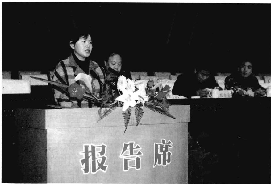
英名永记人们心中