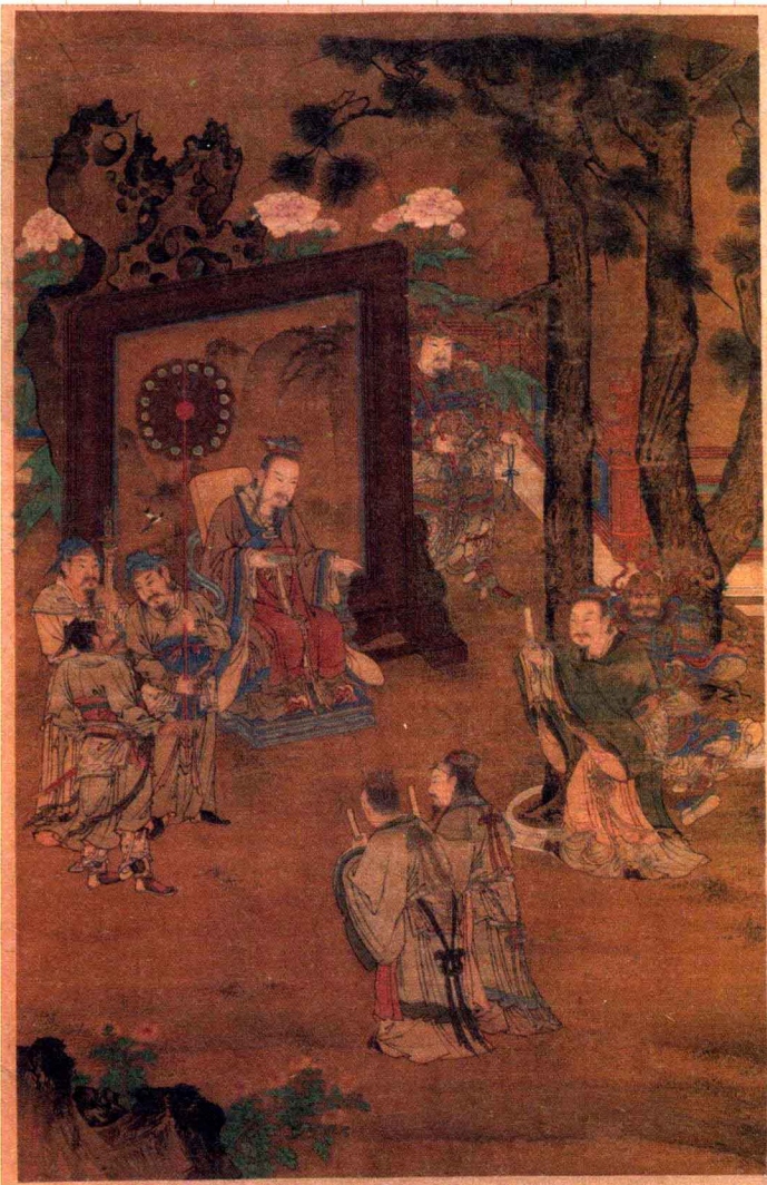
明·刘俊·汉殿论功图

汉高帝曰：『夫运筹策于帷幄之中，决胜于千里之外，吾不如子房；镇国家，抚百姓，给饷馈、不绝粮道，吾不如萧何；连百万之军，战必胜，攻必取，吾不如韩信。三人者，皆人杰也。吾能用之，此吾所以有天下也。』——《人物志》曰：『夫一官之任，以一味协五味；一国之政，以无味和五味。故臣以自任为能，君以能人为能；臣以能言为能，君以能听为能；臣以能行为能，君以能赏罚为能。所以不同故，能君众能也。』——