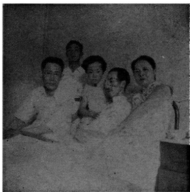
(一九四三年七月攝於醫院)