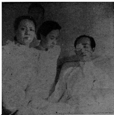
韜奮先生病中與家屬合影