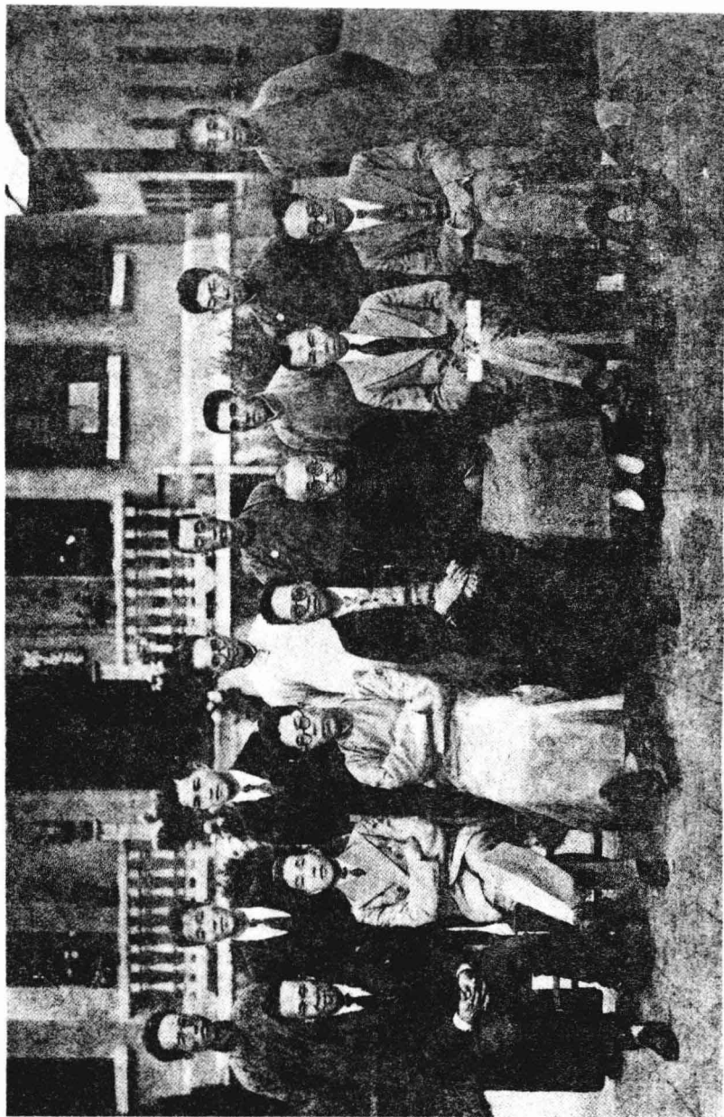
實業部經濟編年委員會常務委員同人攝影