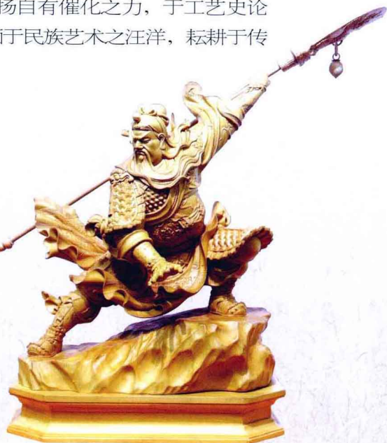
龙谭虎穴何足惧 上海帝王根艺