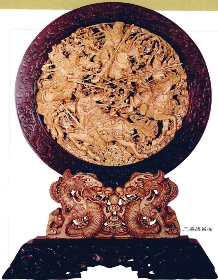
三英战吕布 陆光正