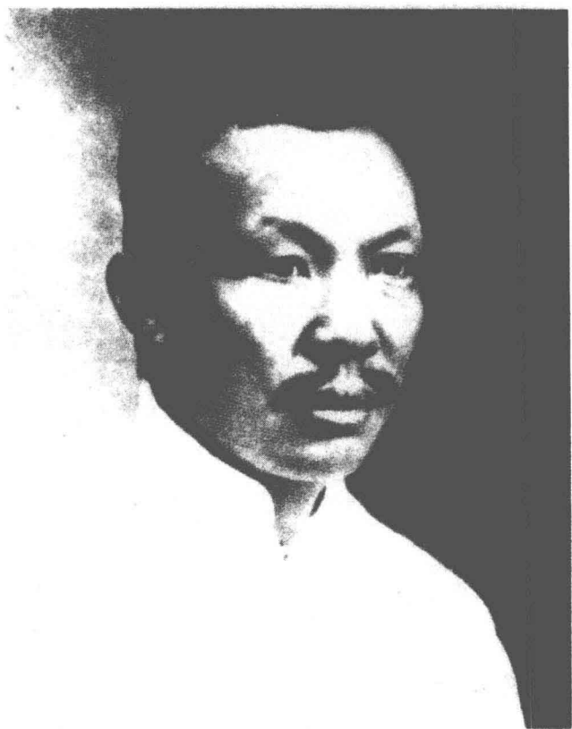
著者小影，时年四十二岁