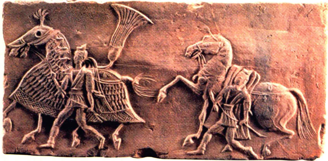
重装甲马画像砖·南朝