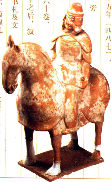
双层甲冑骑兵俑·南北朝

宋武帝刘裕出身于寒门庶族，却建立了南朝历史上的刘宋王朝，刘裕不仅武功卓著，而且在文治上也很有作为，解决了很多东晋政权积累的社会问题和政治问题。南宋时代著名的大词人辛弃疾在《永遇乐》中赞叹刘裕道：『想当年，金戈铁马，气吞万里如虎。』足见其作为开国之君的风采令后人何等倾仰。