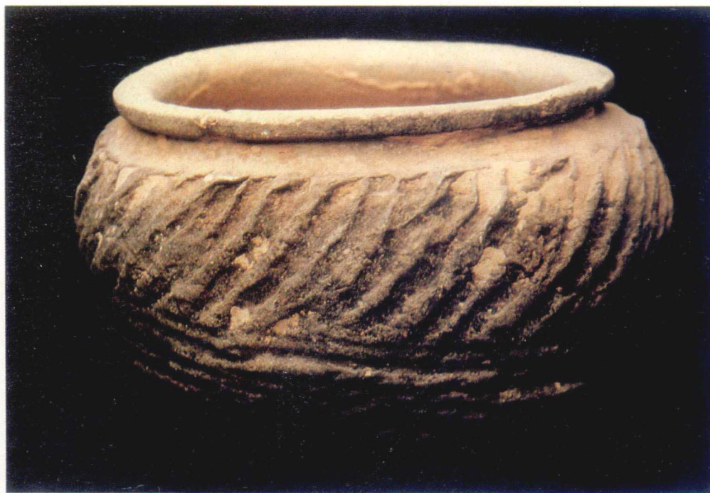
藏館物博 史歷立國(土出武廣南河均)件二罐陶紋繩前史 ▲