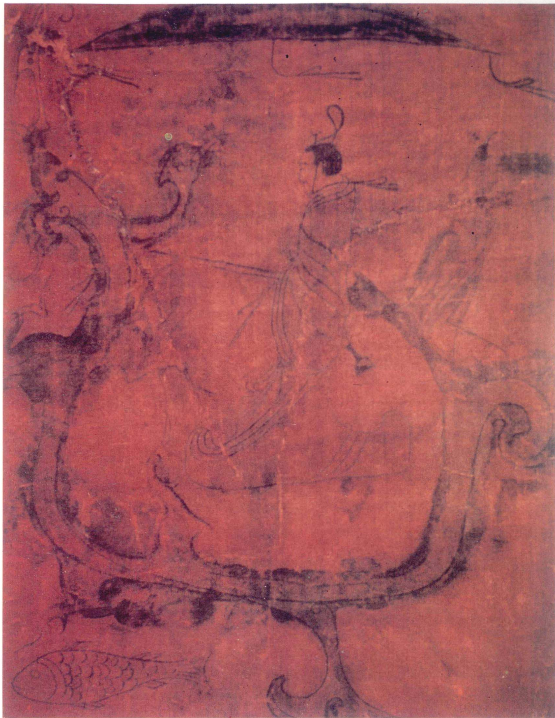
圖牲殺、獵狩 周晚 ▲