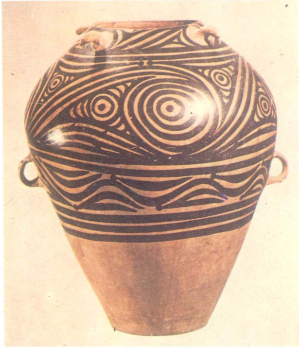
▲新石器時代馬家窯式渦紋彩陶甕