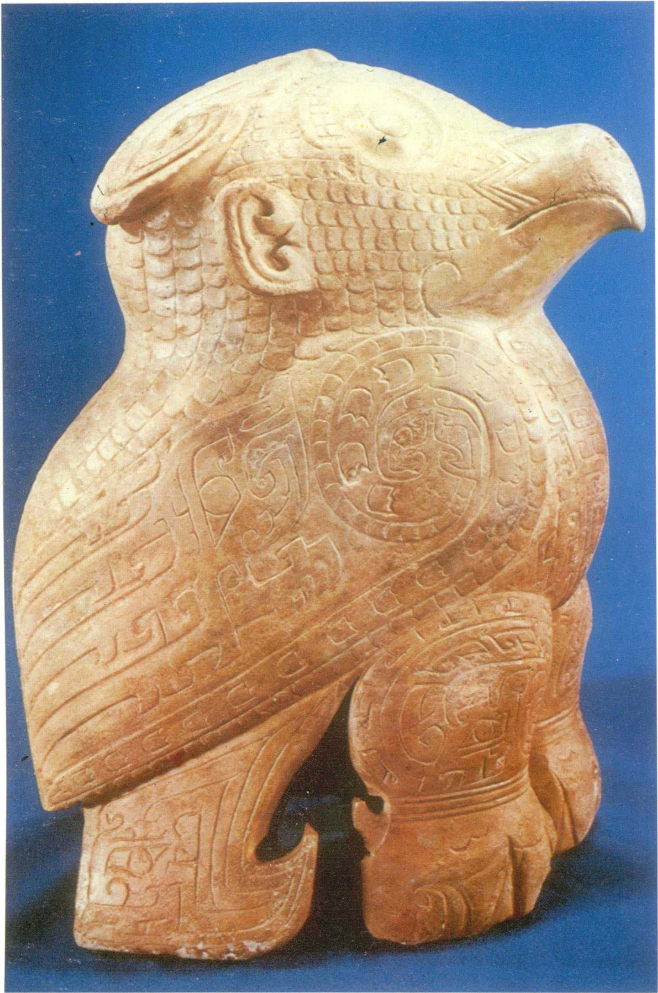
▲商 大 理 石 雕 立 象