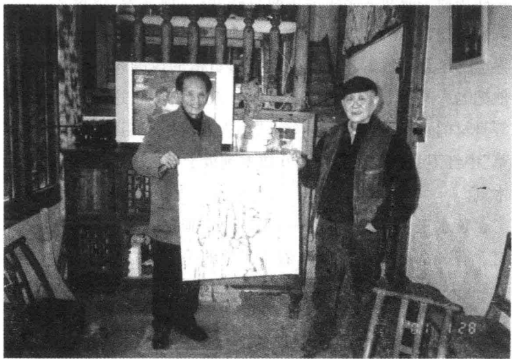
作者与黄永玉(右)在凤凰夺翠楼留影

浙江嘉兴秀州书局主持人是范笑我，他定期出版五页很有看头的《书讯》。有一则报道说，5月9日钟妙明来买书，声称：“我是黄迷，凡是黄永玉的书我都买，包括画册。画册买去，一般