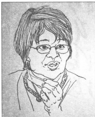
宫部美雪 Miyabe Miyuki (1960— )

原名“矢部美雪”，一九六〇年出生于东京。毕业于东京都立墨田川高校。二十三岁进入法律事务所工作，白天在法律事务所当速记员，晚上到讲谈社主办的小说写作研习班学习写作。一九八七年以《邻人的犯罪》出道，几年间拿下所有相关的文学奖项，并连续七年成为日本最受欢迎的女作家，得到“平成天后”的称号。在日本出版界，有着“男东野，女宫部”的提法，其魅力可见一斑。许多日本作家认为，宫部美雪最有资格继承吉川英治、松本清张和司马辽太郎的衣钵，还将她封为“松本清张的女儿”。