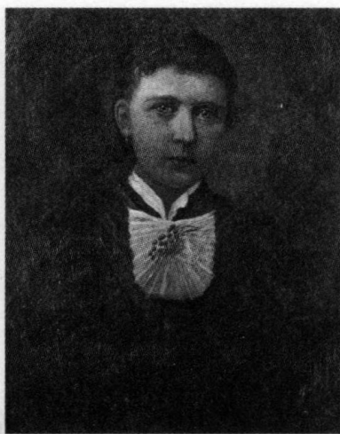
✦ 希特勒的母亲克拉拉·希特勒，出生于波尔泽尔。

在那里一直住到1895年4月 ① ，之后他又奉调前往林茨市，就任海关税务官员。六岁的希特勒随父亲来到费什哈姆，一个位于林茨西南部的小城，并开始在当地上小学。退休之后，阿洛伊斯·希特勒又搬了几次家，阿道夫跟随父亲搬迁，相继在郎八什小学和德里小学就读，直到1900年9月，才进入林茨市的职业技术中学。阿道夫在那里度过了四年的时光，随后考入了斯太尔州立学校，但是一年以后（1905年），他就辍学了，自此放弃了学业。