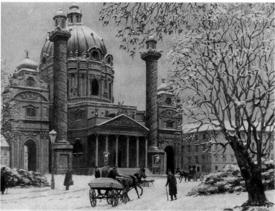
✦ 希特勒笔下的维也纳圣卡尔大教堂，绘于1910年。

据当地人回忆，这个内向的年轻人懒惰麻木，从不工作，就是最喜欢的绘画这码事，也是心情好的时候才偶尔做做。希特勒的人格特征在这段时间开始显现，让他为数不多的朋友们很是震惊。库彼茨克，一个音乐系的学生，1908年曾与阿道夫在维也纳同住过四个月，他说当时的希特勒充满怨恨，多疑、自大、偏执，而且鄙视女人，周期性暴怒，时常表现出“瓦格纳式的忧郁”。最后他总结说：“当时我真的担心希特勒会变成一个疯子。”这位未来的领袖在这段时间好像没有任何进步，他身边的朋友们都回忆说，看过他画水彩、素描，谈天说地，却没有见过他读书，那时他只读那为数不多的几种东西，包括两本上古日耳曼神话故事 ① 、一