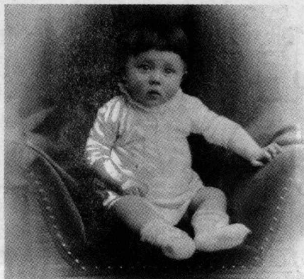
✦ 十八个月大的阿道夫·希特勒。

以下是被确认无误的事实：阿道夫·希特勒于1889年4月20日出生在因河畔的布劳瑙，一个位于奥地利西北部、靠近巴伐利亚的小镇；其父是阿洛伊斯·希特勒，其母克拉拉·希特勒。阿洛伊斯是约翰·格奥尔·西德勒同玛利亚·安娜·席克尔格鲁贝尔所生的儿子，二人来自一个叫多勒谢姆 ① 的小镇。1892年，海关职员阿洛伊斯·希特勒被调到巴伐利亚的帕绍市，他们