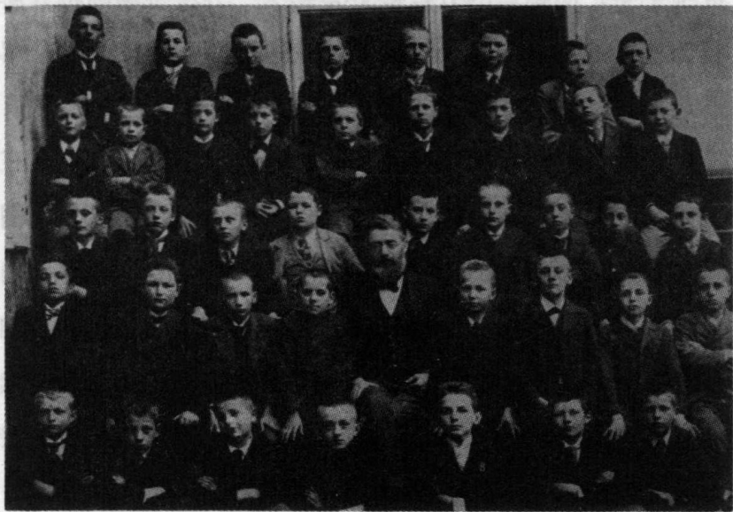
✦ 林茨中学，1901年(希特勒在最后一排最右侧)。