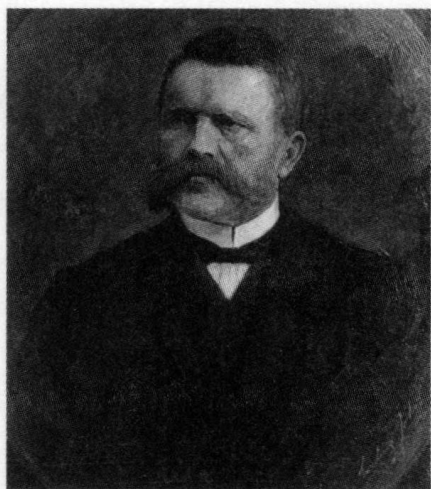
✦ 希特勒的父亲阿洛伊斯·希特勒。