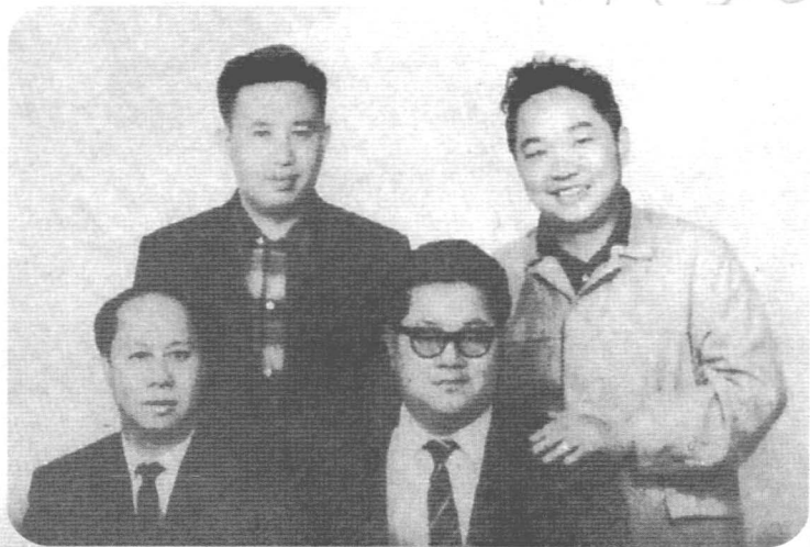
左上 卧龙生，前右 诸葛青云，右上 古龙。