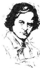
ALBERT HUBBARD 1856-1915