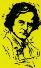
ELBERT HUBBARD 1856-1915