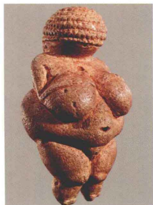
图1-3 威伦道夫的维纳斯（奥地利） 约公元前28000年-前25000年

巨石结构最杰出的代表作是英格兰南部索尔兹伯里的斯通亨治（stonehenge），该词在英语中的意思为“吊起来的石头”。这是一个由五层巨石组成的圆形结构，圆环直径约105英尺（30多米），石碑大约高4—5米。这座石栏可能具有严密的天文学功能，同时也有宗教仪式的作用。这座壮丽的巨石结构令人感觉到人类的渺小，唤起人们一种悲剧性的感情。（图1-6）