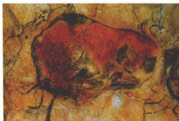
图1-2 阿尔塔米拉洞窟壁画（西班牙）约公元前12000年