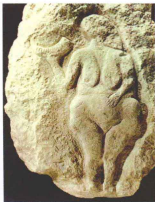
图1-4 持牛角的女人（法国） 约公元前25000年-前20000年