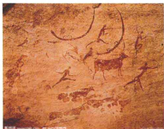
图1-5 拉文特岩画（西班牙） 中石器时代