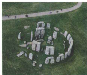
图1-6 巨石栏（斯通亨治）（英格兰） 约公元前2550年-前1600年