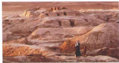
图2-1 古代苏美尔神殿——白庙遗址（伊拉克）约公元前3200年—前3000年

苏美尔人居住于两河下游的平原地区，这里缺少石料，建筑材料主要用泥土做成砖坯，所以他们的建筑很少留下来。但是从现在残留的遗迹来看，苏美尔人曾经有过相当庞大的建筑。当然这些建筑主要是神庙。如位于乌鲁克的白庙，它建在一个人造的不规则山头上，气势十分壮观。它的基座高出平地40英尺（约12米），中间有阶梯直通上面的平台，平台上是神庙，神庙的外墙涂成白色，所以被称为