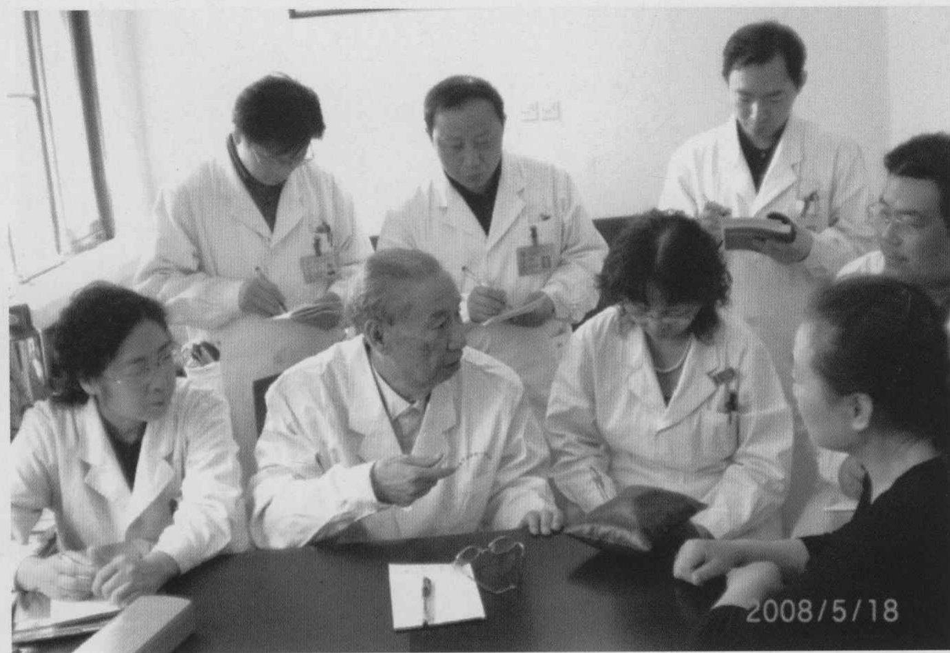
李老带领弟子应诊