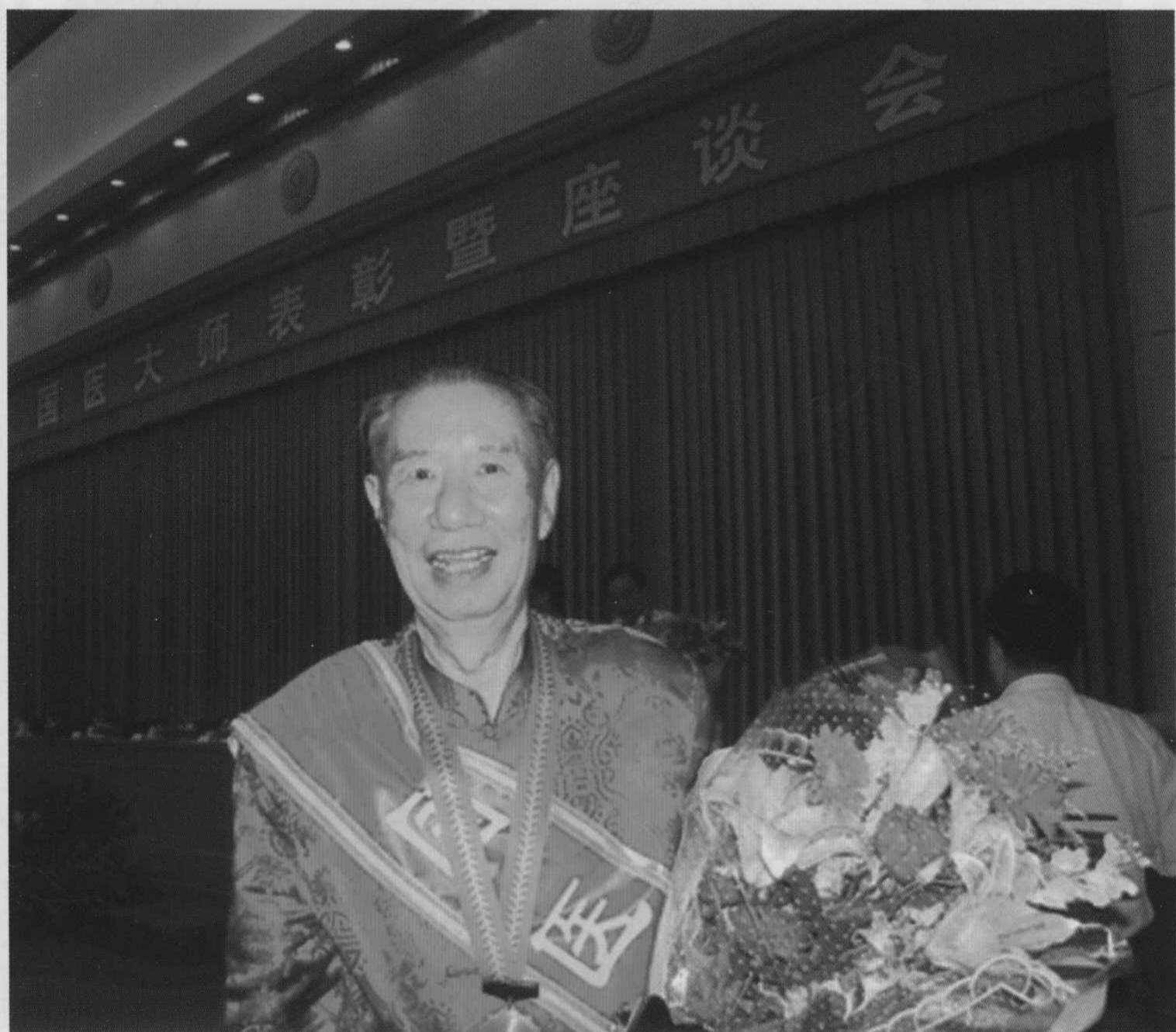
当选首届国医大师