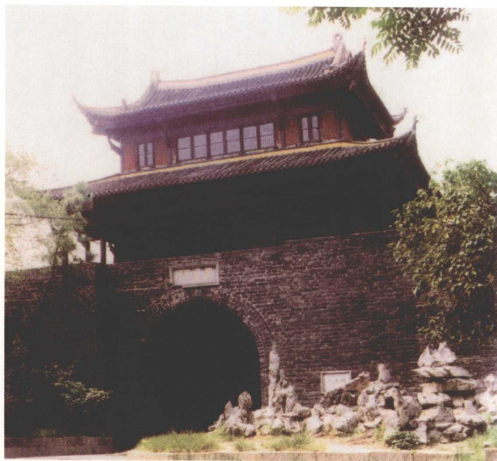
武昌中和门 (武昌起义门)