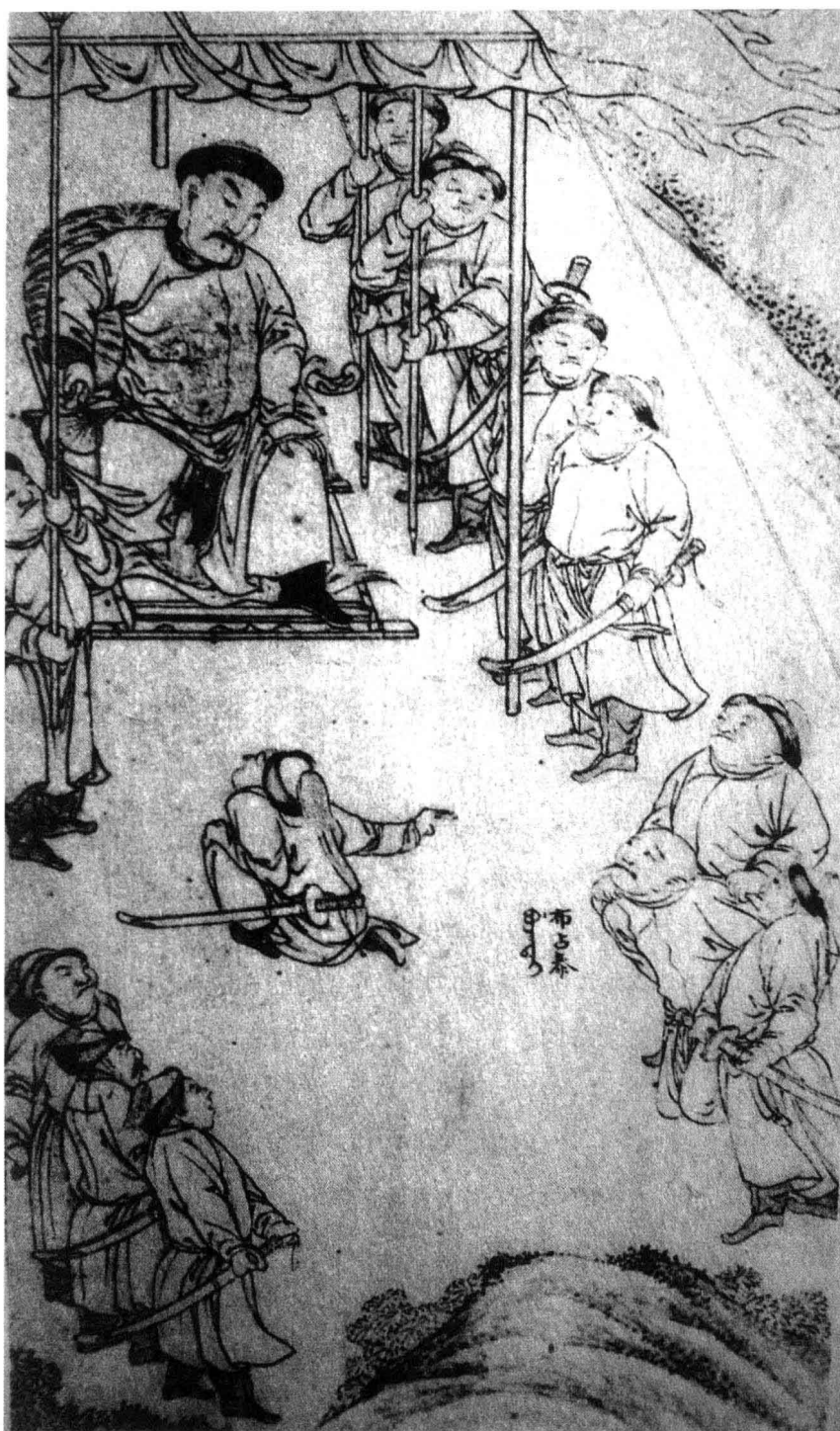
努尔哈赤起兵之后，扈卫之“虾”时刻捍卫汗王安全。