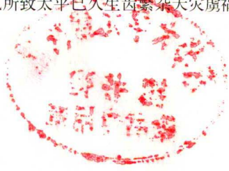
报寇葵衷书 大悲阁上天风为我两人来酒意情忘星辰错入袍袖间此夜梵声云璈帝所梦乐未均于此恨天倏欲曙分我心交使弟快快近日大陆井硯阁左兵駭魄驚未謚羣盜蜂午皆五行敗气所致太平已久生齿繁杂天灾虜祸牙齧相仍

心交使弟快近日 大陸井硯閣左兵 駭魄驚未謚羣 盜蜂午皆五行 敗氣所致太平已 久生齒繁雜天裁 虜駭牙齧相仍