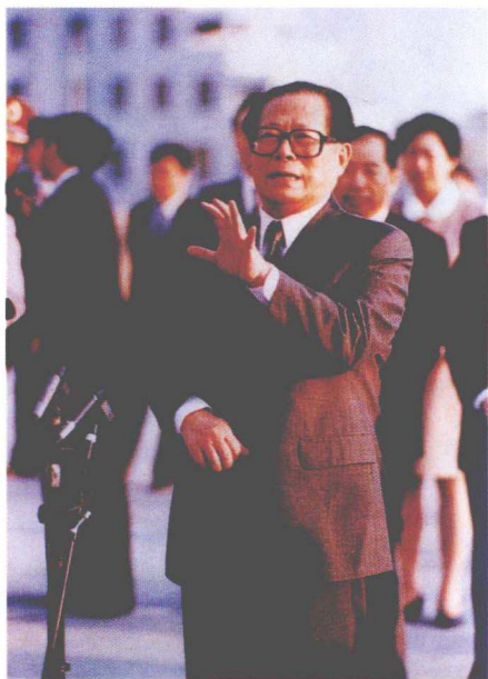
江泽民总书记要求深圳 “增创新优势,更上一层楼”