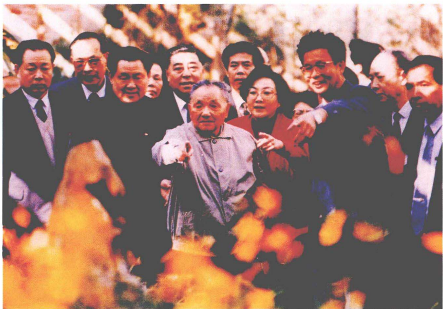
邓小平1992年春视察深圳