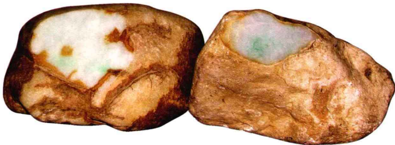
△ 切开后的翡翠籽料

许多人认为既然翡翠名“硬玉”，和田玉名“软玉”，于是就认为翡翠的硬度高于和田玉，这种望文生义的误读是不对的。“硬玉”和“软玉”都是矿物名称，其命名也不是这两种矿物岩石硬度相比较的结果。