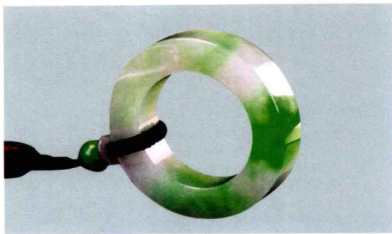
◁ 翡翠平安圈 (来自万瑞祥)