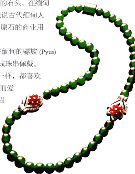
▷ 1930年 圆珠翡翠项链 带红宝石钻石扣

由于缅甸人和世界上大多数民族一样，都喜欢晶体宝石和金银，不喜欢玉石和翡翠，而爱玉的中国人在清代以前还不知道翡翠。因此没有商业价值的翡翠，在缅甸一直得不到重视，在默默无闻中过了近二千年。缅甸盛产红蓝宝石和金银，古代缅甸国王送给别国的礼物