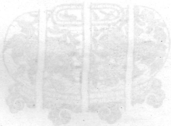
图 11 窗花“金玉满堂”

高密一带流传的剪纸，从农舍的门窗、棚顶到箱柜、衣橱都有剪纸装饰。制作一般不打草稿而放剪直下，其特色是常用锯齿纹和挺拔的线条相结合来构成形象。