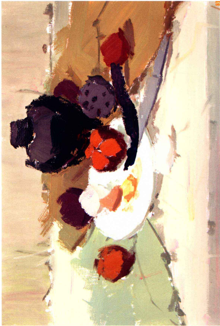
3. 铺大色块 ：概括画面的色彩倾向，用大号笔或刷子完成铺色，静物要表现出一定的体积关系，注意用色要概括、简练，注意同类色的区分及颜色在画面中因位置不同发生的变化。