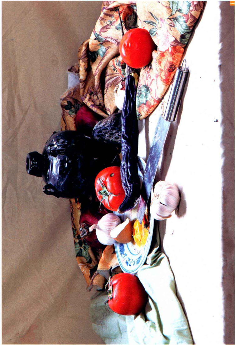
1. 观察照片 ：通过观察静物组合，区分出画面的黑白灰关系，同时对画面中的亮灰色进行归类与区分，理性地区分衬布、白瓷盘和大蒜间色彩的变化关系。