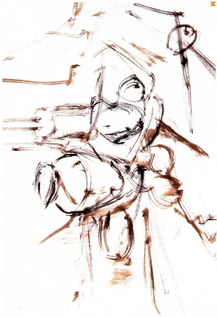
2. 起稿构图 ：起稿用笔可干可湿。如干画，用枯笔干皴，就像使用木炭条画素描般，衬出静物的形体与光影关系。