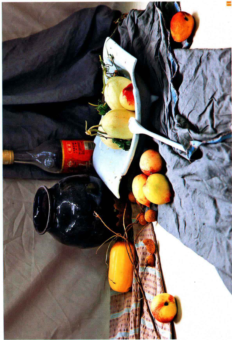
1. 观察照片 ：观察静物时目光应流动在各静物之间，观察它们各自的颜色倾向和联系，以及整幅画面的色调倾向。