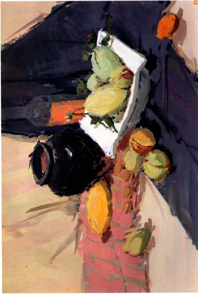
4. 深入塑造 ：遵循从主体物着手，向四周扩散的原则进行深入塑造。注意区分同类色间的变化，如桃子等水果之间颜色的区分等，使得画面富有变化，层次清晰。