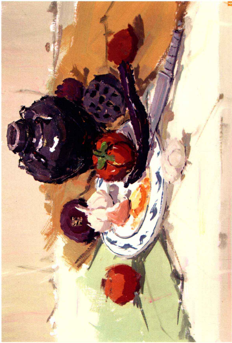
4. 深入塑造 ：深入塑造静物时注意质感的表现、颜色的衔接与色彩的冷暖变化。