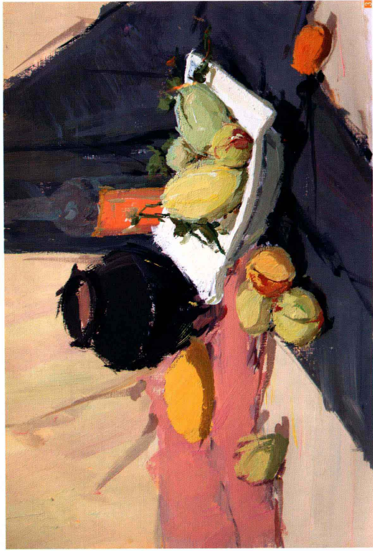
3. 铺大色块 ：从面积较大的色块铺色，确定其基本色调倾向。铺色时注意画面大的色彩关系、冷暖关系和纯灰关系等。继续表现较小静物的固有色，区分出黑白灰关系。